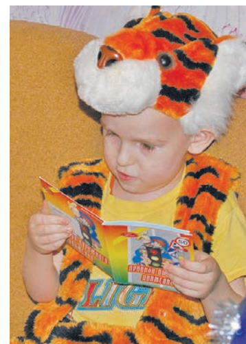
Самым лучшим подарком оказалась книжка с правилами дорожного движения

В общежитии 6а микрорайона мы должны были по-