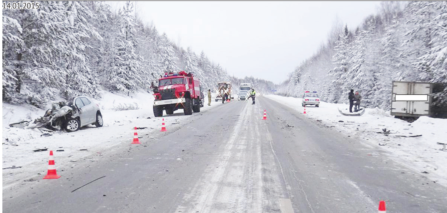
6 января авария в районе Кушвы унесла жизни мужа и жены