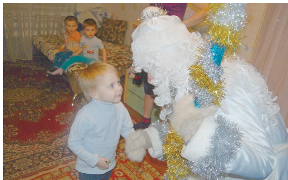
Загадать Снегурочке самое заветное желание