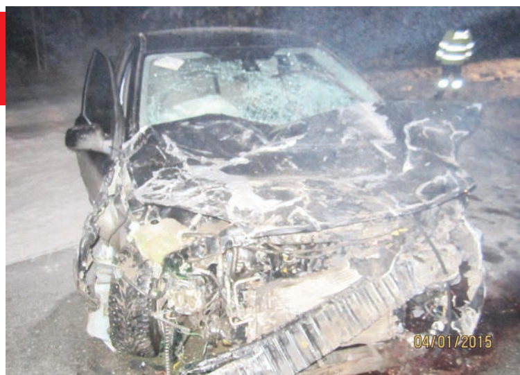
В результате этого ДТП под Нижней Турой погиб мужчина

В ДТП погиб 34-летний пассажир, который находился на переднем сиденье в «Шкоде».