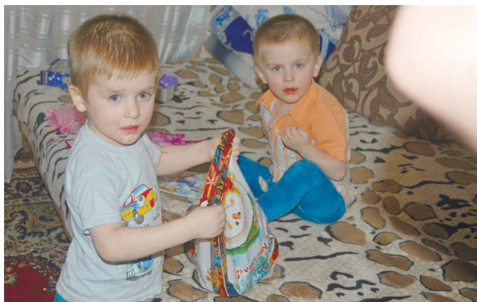
Соседские мальчишки не остались без сладостей от Деда Мороза со Снегурочки