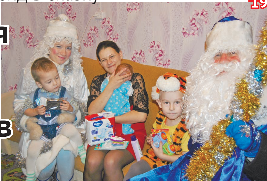
Три богатыря встречали сказочных героев нарядными