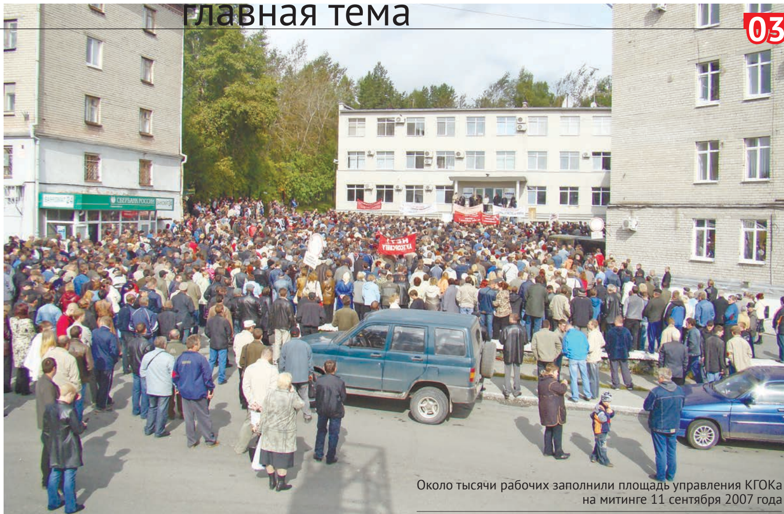
Около тысячи рабочих заполнили площадь управления КГОКа на митинге 11 сентября 2007 года

Однако дальнейшие события развивались по знакомому сценарию в наши дни: вывод комиссии для Евразы значения не имел, выполнять ее решение руководство