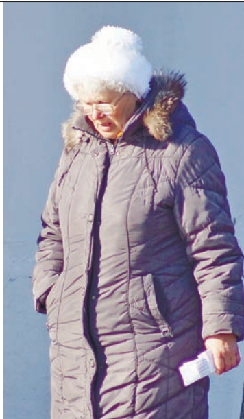
Сотрудники ИП Вагнера целыми днями ходят вокруг автовокзала, периодически закрывают двери, говоря, что автовокзал не работает, и предлагают покупать билеты у них.

Больше я так ездить не хочу! Стараюсь сейчас покупать билеты на автобусы