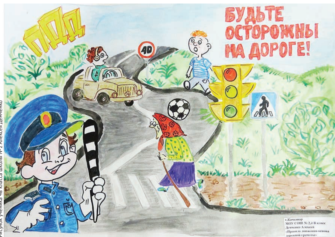
Рисунок ученика 4в класса школы №2 Алексея Демченко

В начале апреля жюри подведет итоги. Лучшие работы будут использоваться для издания демонстрационных плакатов и иллюстраций к методической литературе.