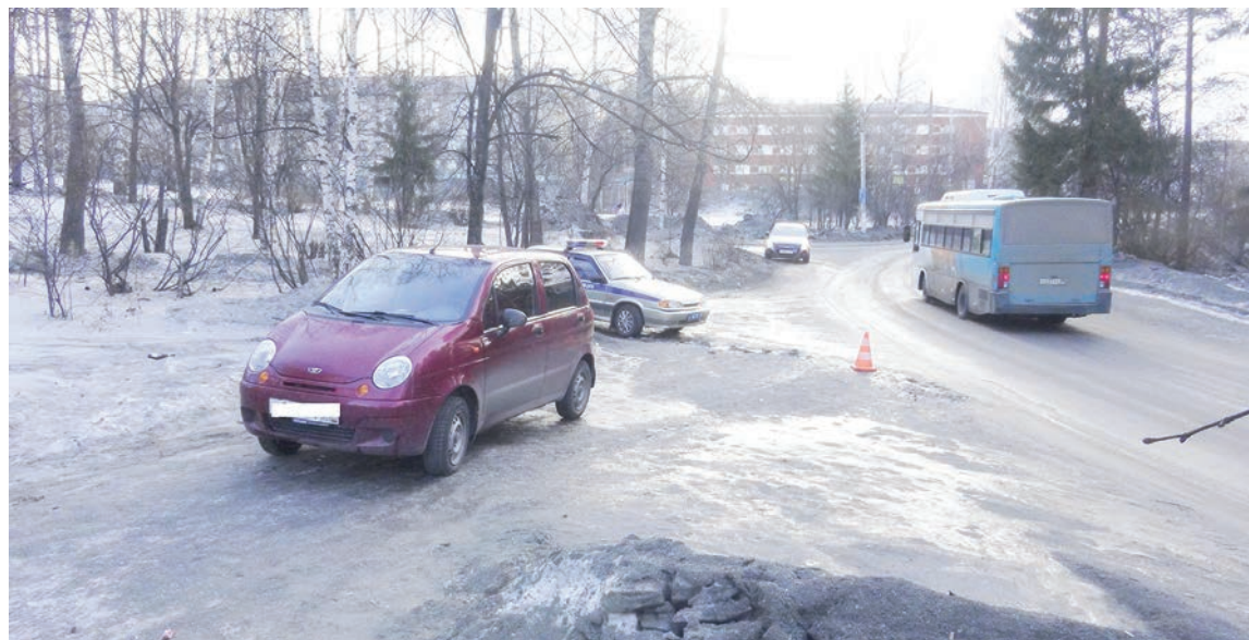
Коммунальщики принялись за очистку этой дороги только после несчастного случая

— Малыш в коляске оказался прямо под машиной. Свидетели ДТП помогли поднять «Матиз» и извлечь ребенка. Малыш госпитализирован с диагнозом «за-