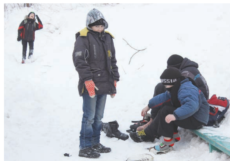
Когда нет игр и тренировок, мальчишки приходят на корт покататься на коньках