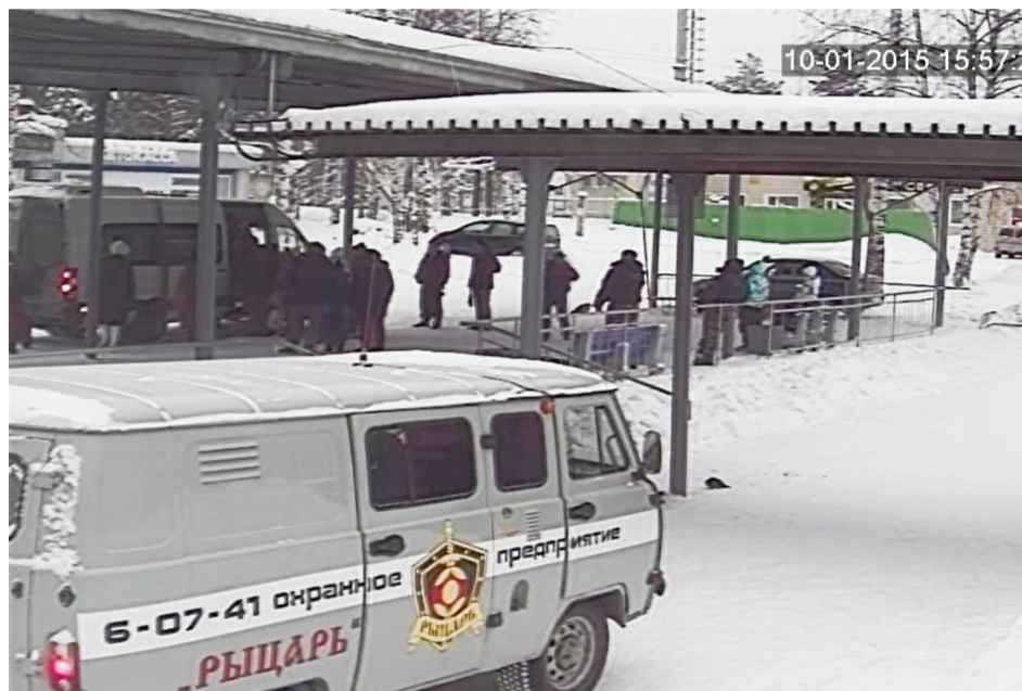
Видео предоставлено администрацией автовокзала