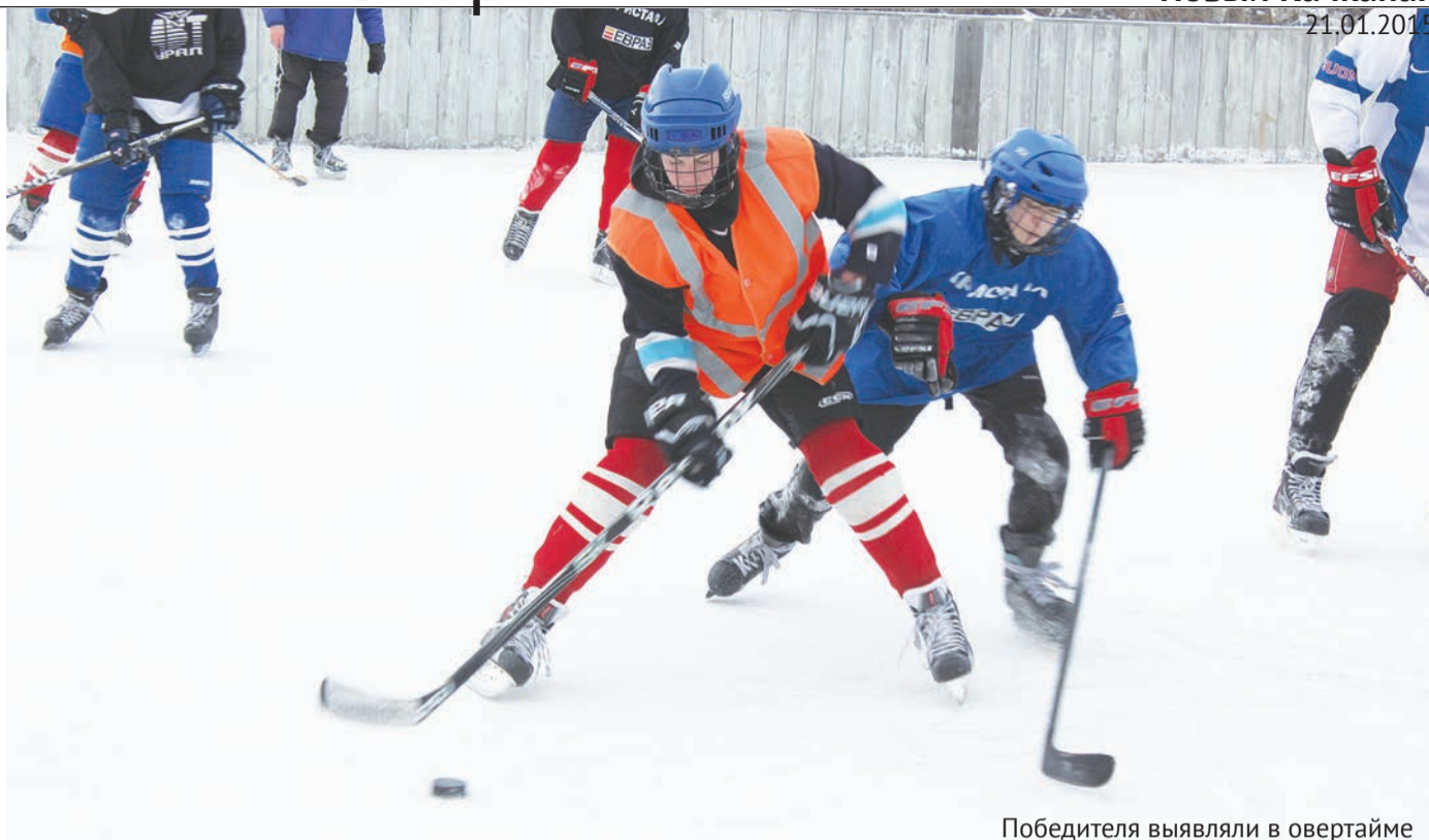
Победителя выявляли в овертайме

В субботу, 17 января, был дан старт ежегодным соревнованиям по хоккею на призы генерального директора «АВТ-Урал». Как рассказывают организаторы, в этом году в борьбу решили вступить четыре команды: «Спасатель», «ГЦД», «Пересвет» и «АВТ-Урал». В этот день на лед вышли команды «Спасатель» и «ГЦД».