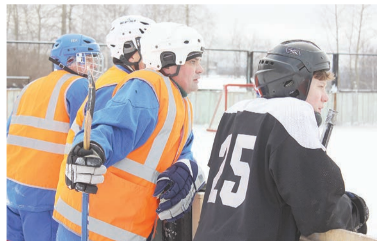
Болельщиков было немного, в основном, болели отдыхающие игроки