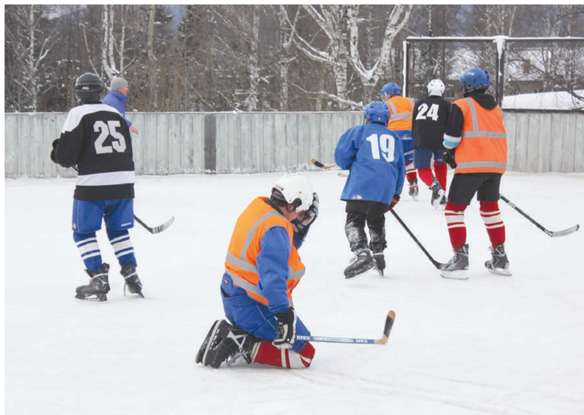
Игра была напряженной. Не обошлось без падений