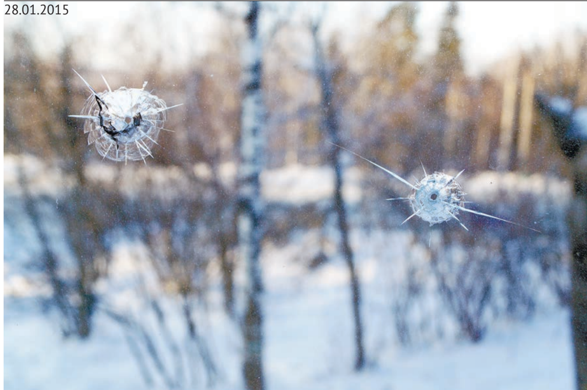
Магазин «Тройка» тоже пострадал от хулиганов

ступления зависит в первую очередь от граждан: