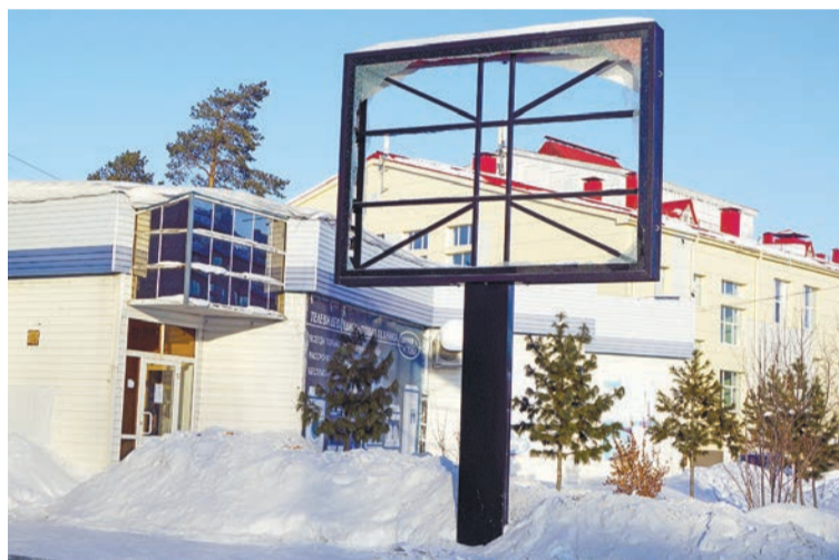
Щит у «Центрального» избавили от стёкол

Чтобы быстрее найти преступников, надо сразу же вызывать полицию. Население должно само в первую очередь реагировать, чтобы мы поймали правонарушителя. А то у нас на днях была квартирная кража: воры час выламывали двери, а потом таскали вещи, и никто из