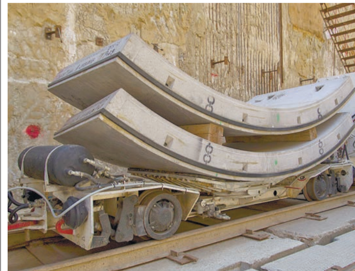
Элементы сборной конструкции