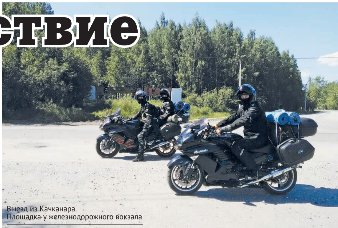
Выезд из Качканара. Площадка у железнодорожного вокзала