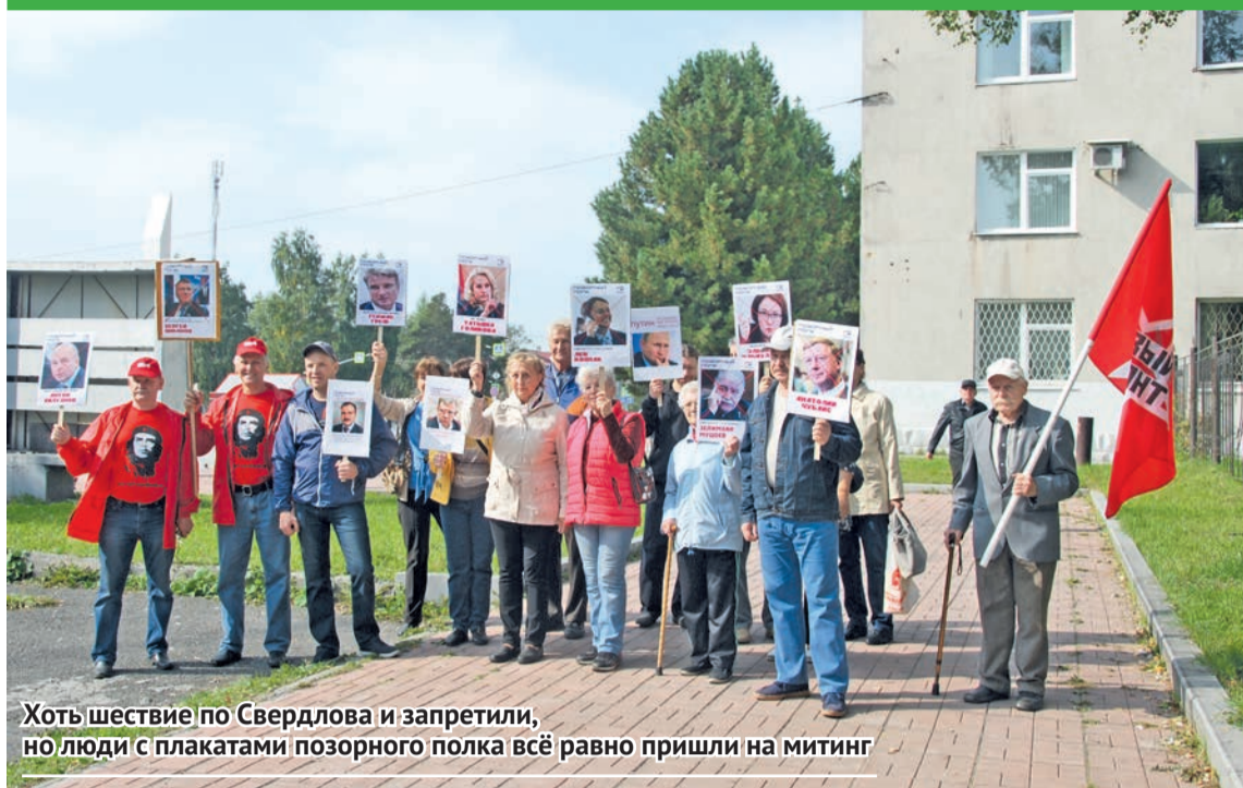
Хоть шествие по Свердлова и запретили, но люди с плакатами позорного полка всё равно пришли на митинг

рода, деградация в стране не только в медицине и образовании, но и в умах. Надеяться на то, что власть сама пойдет навстречу народу – ни в жизнь такого не было и не будет. Пока люди не поймут, что это их будущее, – ничего не изменится.