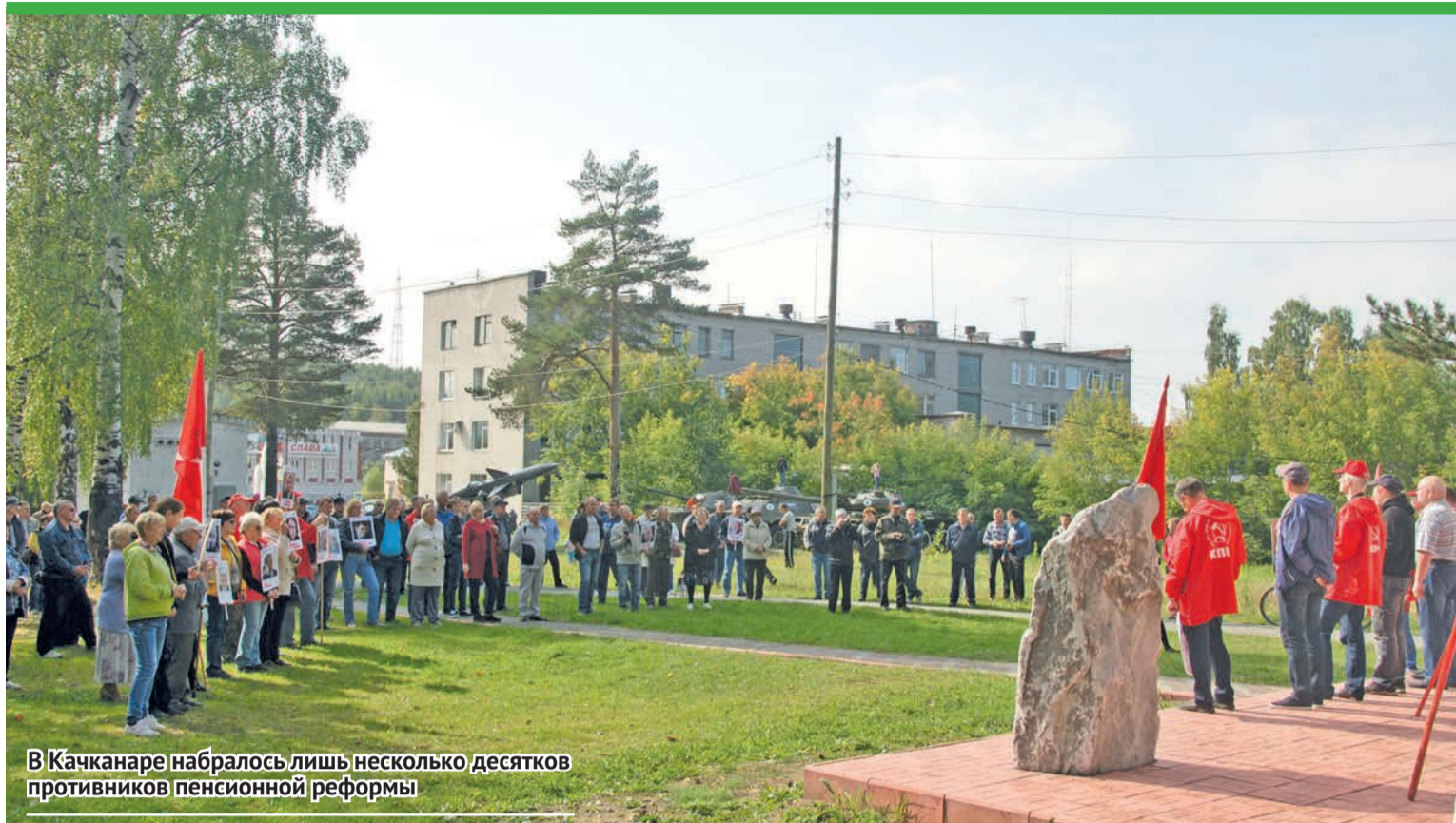
В Качканаре набралось лишь несколько десятков противников пенсионной реформы