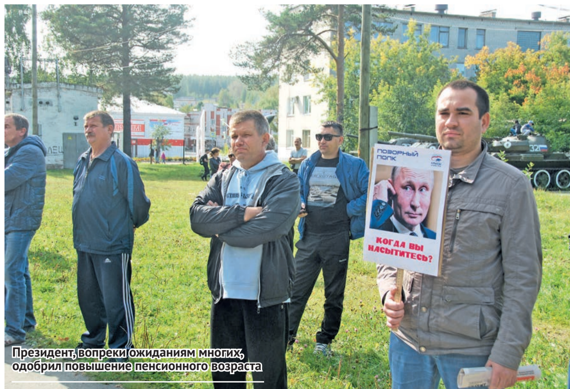
Президент, вопреки ожиданиям многих, одобрил повышение пенсионного возраста

Вот про революцию говорят, да не повторится у нас 1917-й год, у нас нет того на-