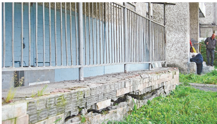
У входа в подвал