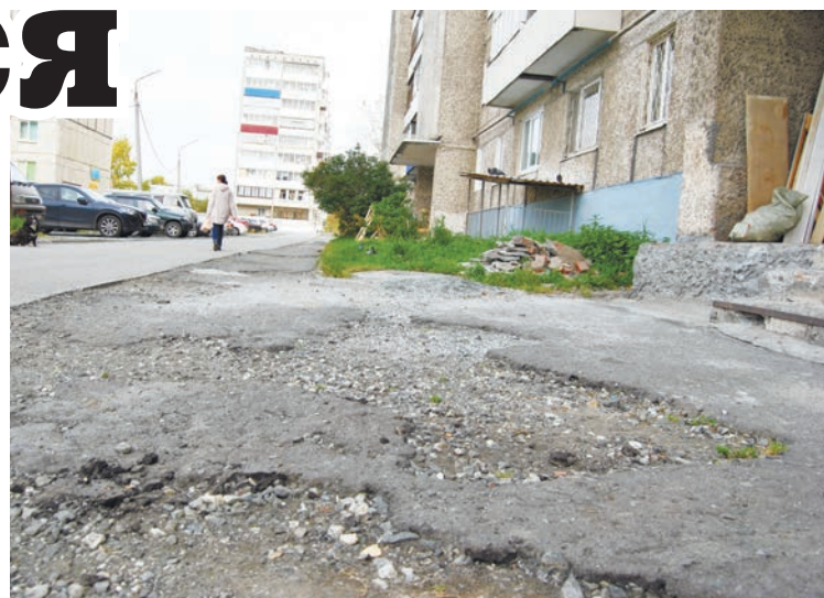
Тротуар ждет снега