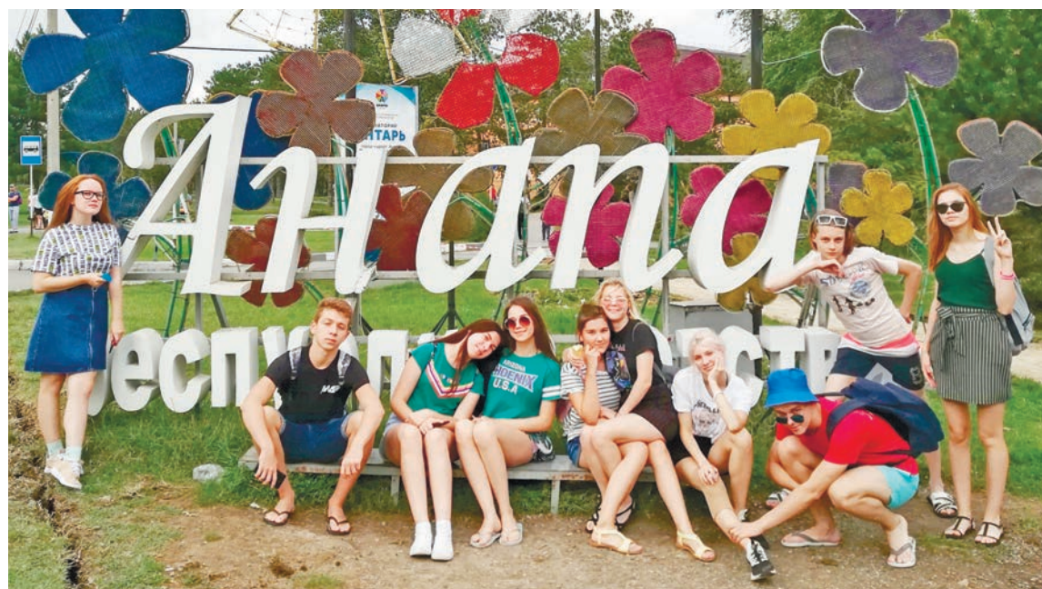
Команда КВН из Качканара «Ближе к делу»