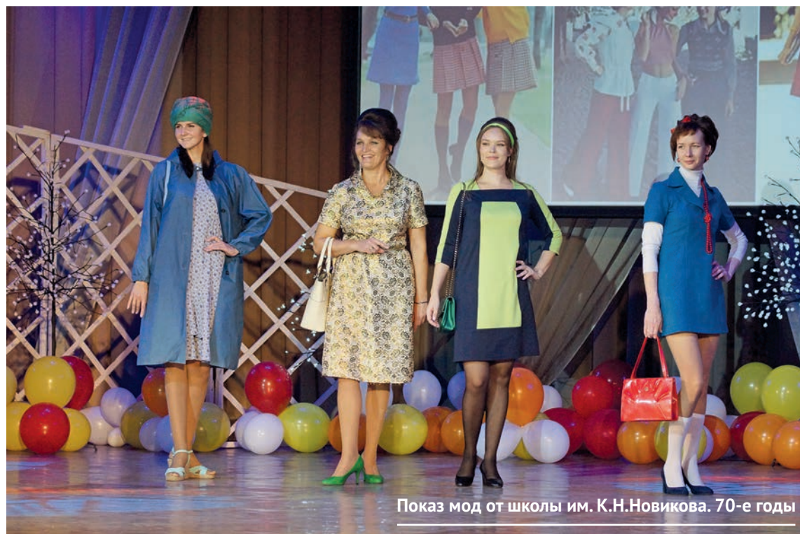
Показ мод от школы им. К.Н.Новикова. 70-е годы