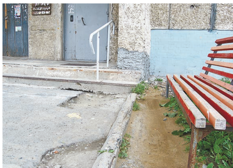
Подобное крылечко есть у каждого дома