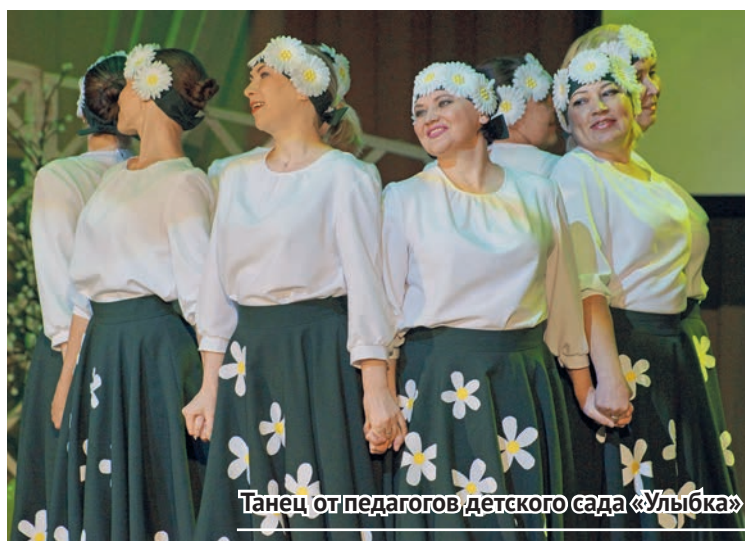
Танец от педагогов детского сада «Улыбка»

Подробный фотоотчет с Дня учителя есть в редакции «Нового Качканара». Желающие получить своё фото для личного архива могут подойти в редакцию с флэшкой.