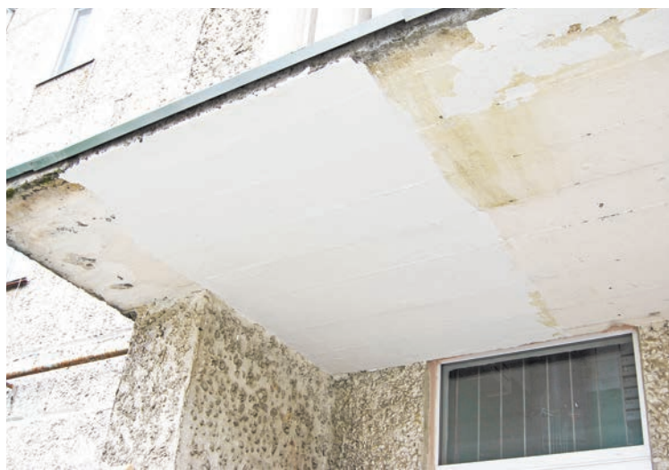
Похоже, устали шпаклевать