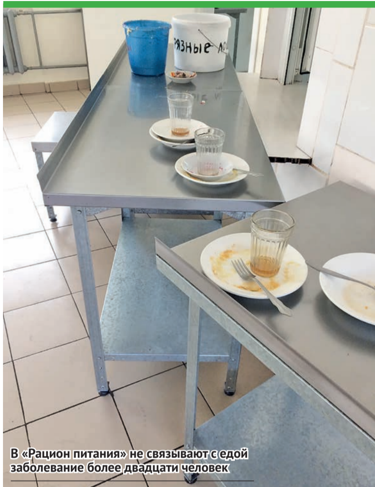
В «Рацион питания» не связывают с едой заболевание более двадцати человек