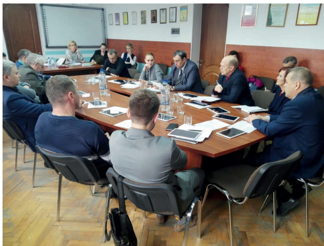
Вопрос, вынесенный на думу, оказался не в компетенции депутатов

В соответствии со статьей 32 Жилищного Кодекса РФ, мы можем собственникам квартир в этих домах выплатить компенсацию. Но, посоветовавшись с министерством и главой, приняли решение обеспечить людей жильем. Для того чтобы обеспечить жильем, необходимо у них квартиры из частной собственности обратить в муниципальную. Тогда они станут нанимателями, и мы сможем предоставить им соответствующее благоустроенное жилье в квадратных метрах не менее