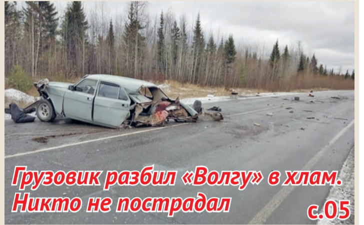
Грузовик разбил «Волгу» в хлам. Никто не пострадал