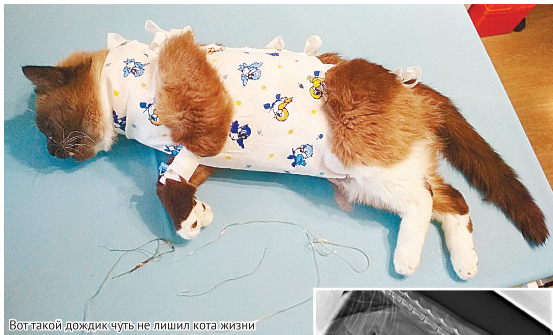
Вот такой дождик чуть не лишил кота жизни

Через неделю обеспокоенные хозяева понесли кота другому врачу. Да, это часто