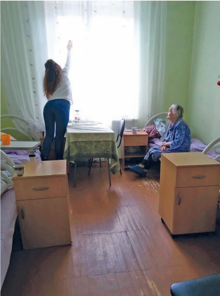
Сотрудники «Заботы» находят подход к каждому проживающему

— Закройте окно, мне так душно, а я не достаю, — жалуется одна из женщин.