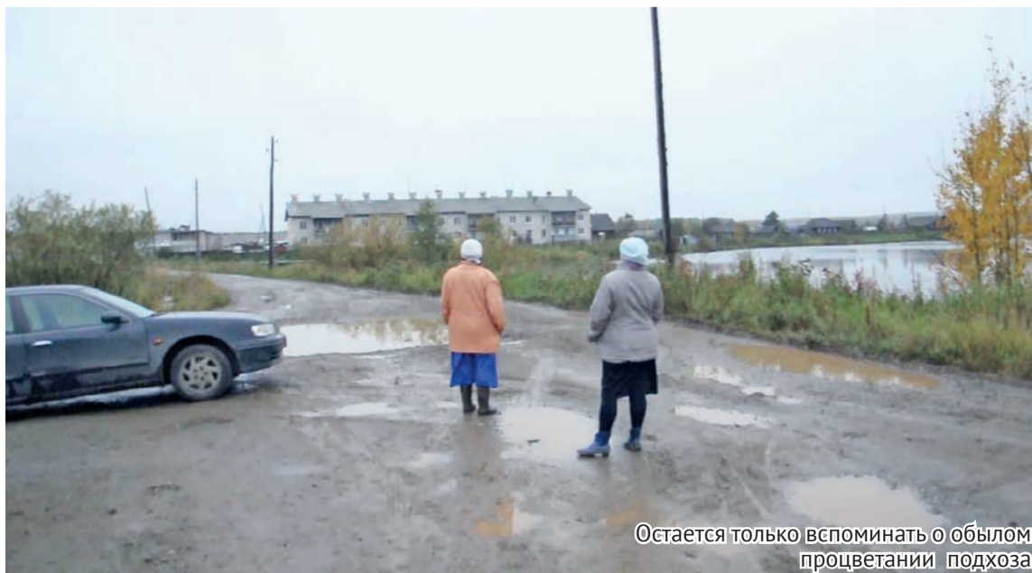
Остается только вспоминать о былом процветании подхоза

Причем в орсе, на радиозаводе, помимо тепличных мощных хозяйств, и свои свиноводческие были. До полутора тысяч голов содержалось!