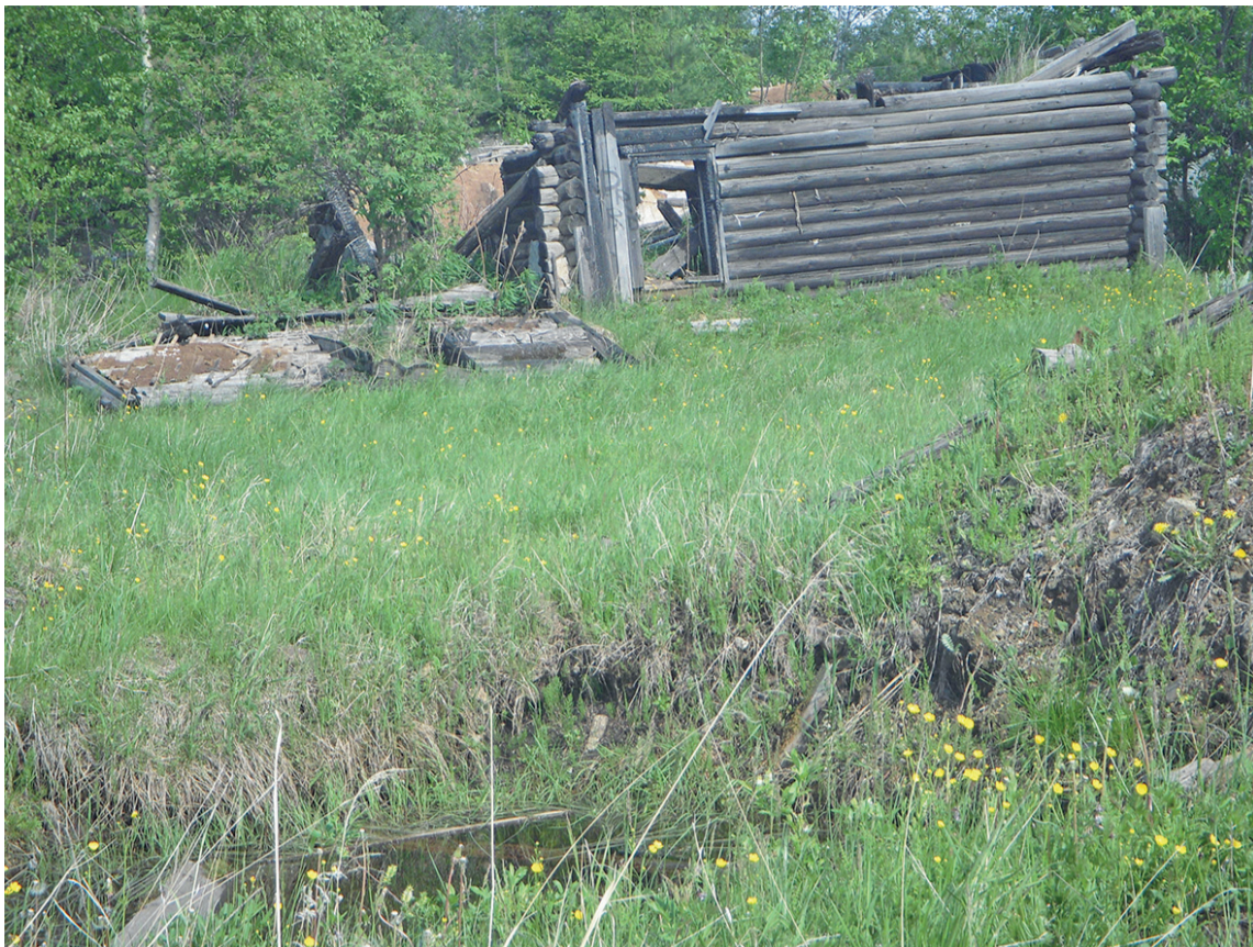
Останки строений на месте когда-то процветающего подхоза. Мерзость запустения.

На одном только Сигнальном было постоянно занято до 370 человек. Овощеводы, скотники, доярки, механизаторы. В сенокосную страду привлекались работники комбината.