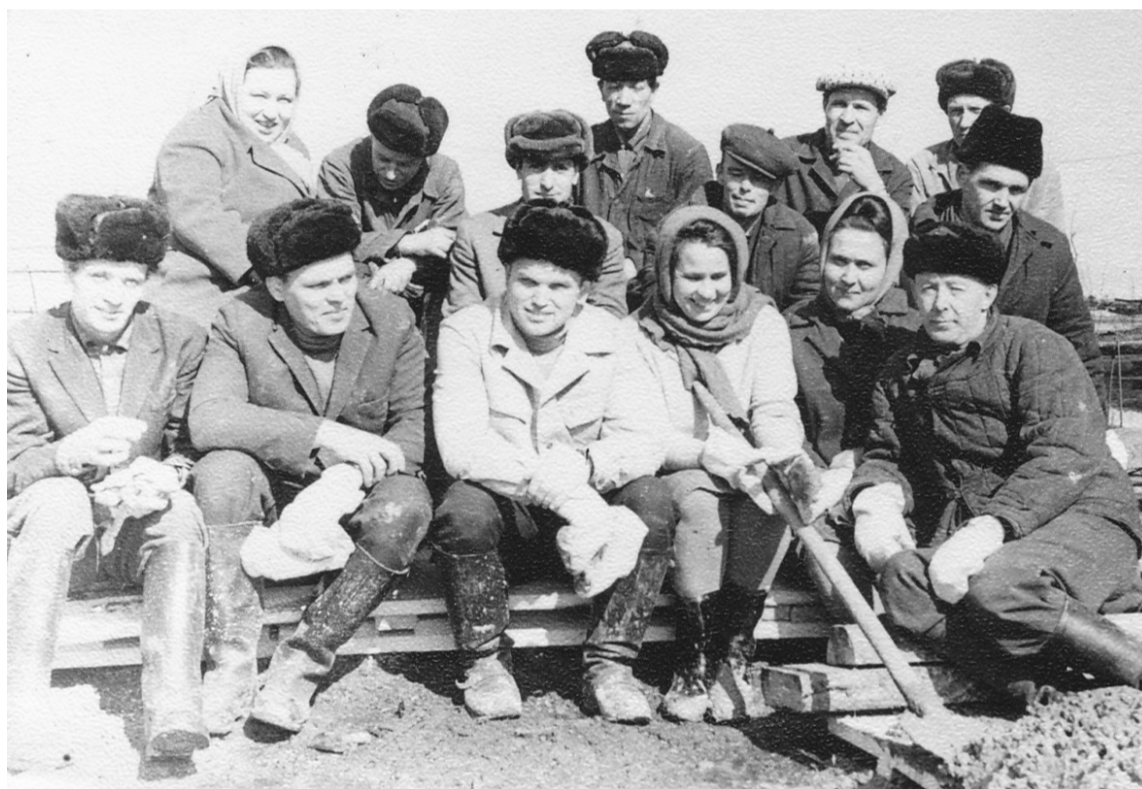
Вот они, молодые, задорные строители нового завода