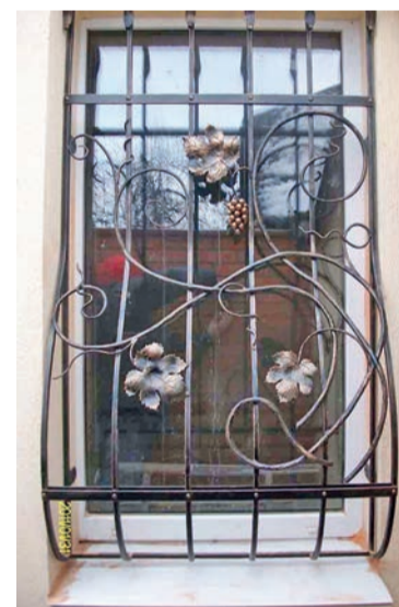
Решетка на окно

Нахожу различия. На кованом листике, как на настоящем, выгравированы мелкие переплетения прожилок, центрального стебелька. И, честное слово, он видится даже зеленым. Только что нет пушинок на поверхности. Даже чудится, что теплом, накопленным от солнца, греет он ладонь. И не будет, как и в живой природе, двух одинаковых таких листочков, как не может артист одну и ту же вещь два раза совершенно одинаково исполнить. Все зависит от сиюминутного душевного настроения исполнителя, какой бы устный или нотный текст ни был перед ним.