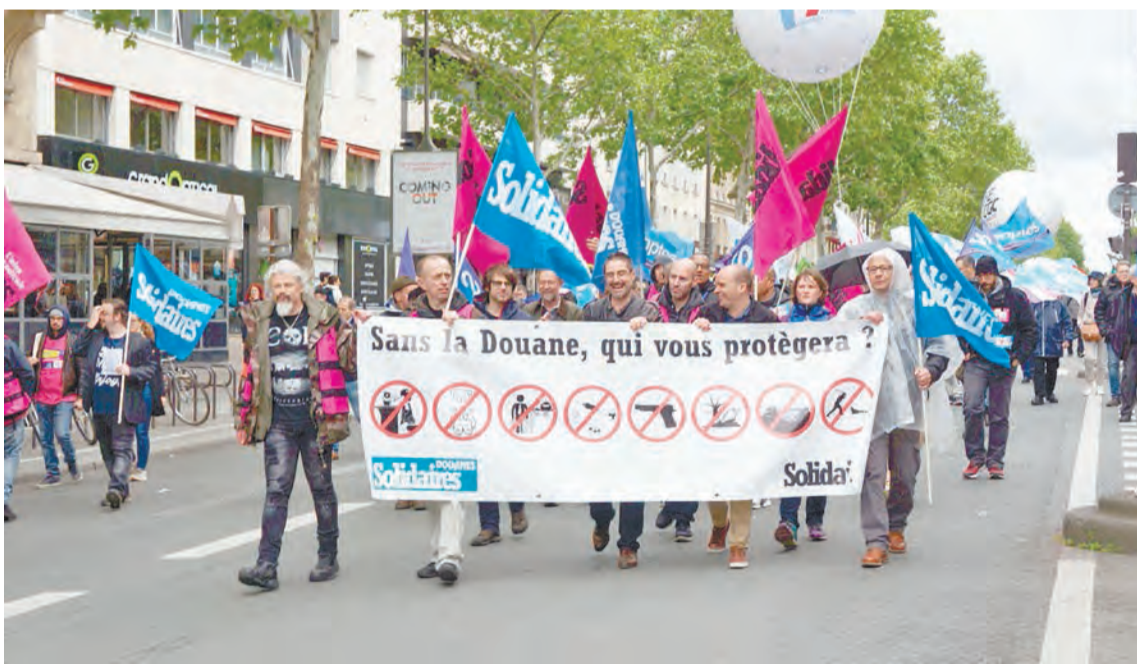
Протестующие в Париже свободно ходят по улицам