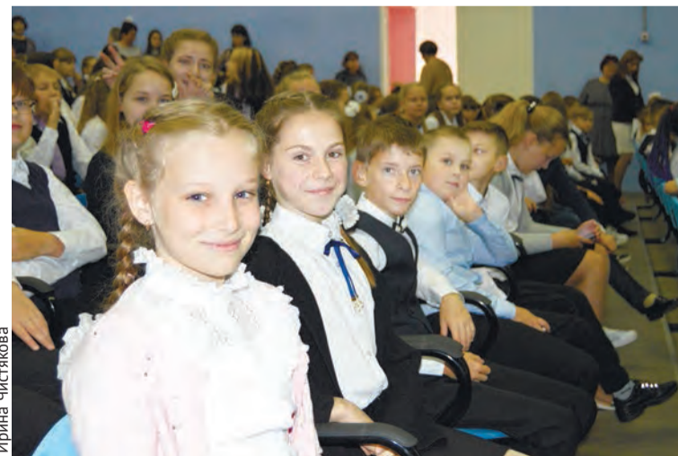
Линейка во второй школе