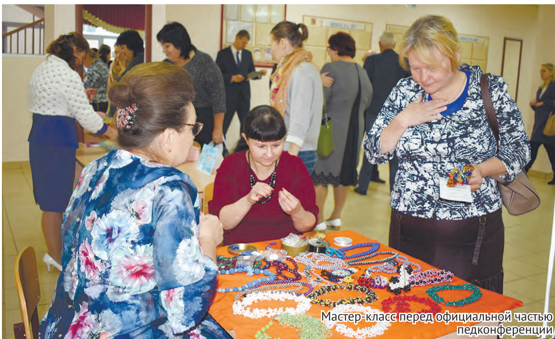
Мастер-класс перед официальной частью педконференции