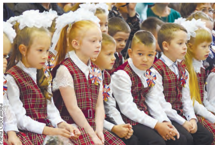
Первоклассники школы им. К.Н. Новикова