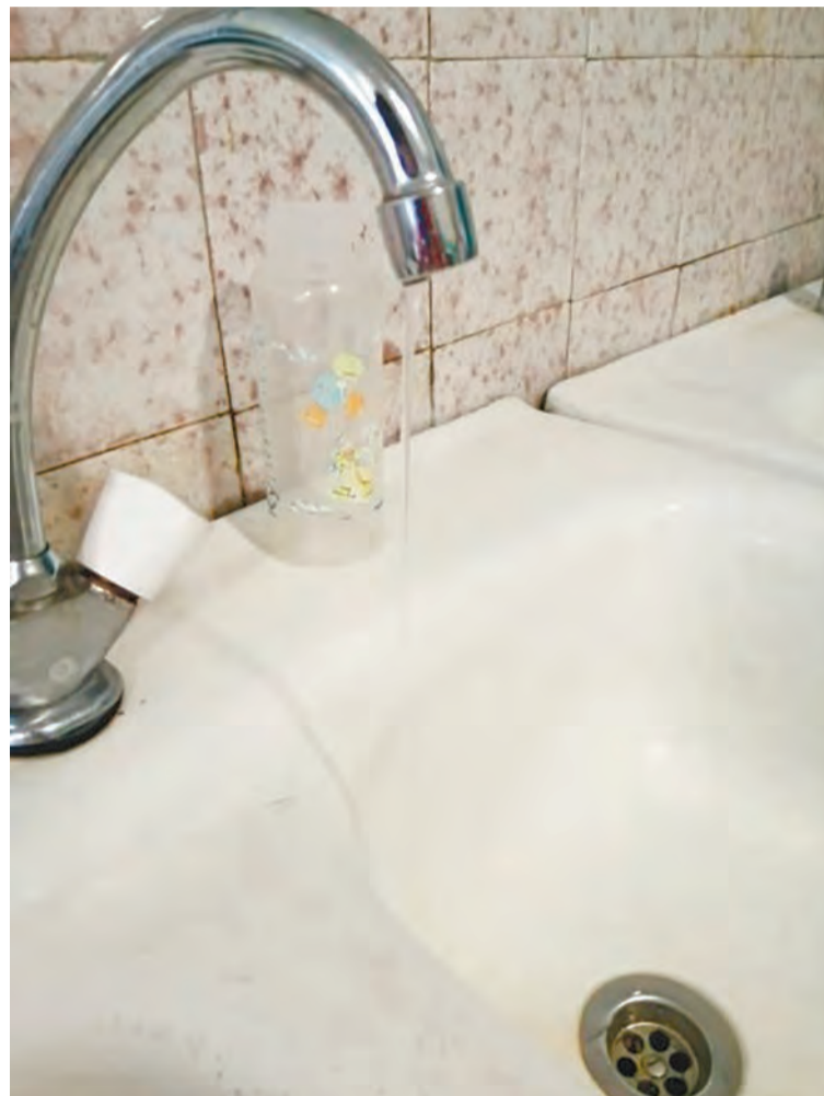
Такая струйка холодной воды бежала из крана на первом и втором этажах. На третьем и четвертом этажах холодной воды не было совсем.

Что же касается аварийного отключения, в этой