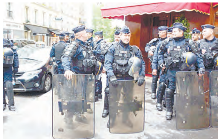
Жандармы — на охране порядка

P.S. Не смог не присоединиться к митингу, услышав припев «полис соси». На все вопросы отвечал, что я за профсоюзы. #жёлтыежилеты