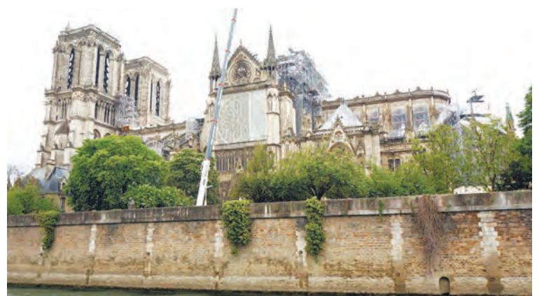
Пострадавший в пожаре собор Нотр-Дам

сколько она искусственно навязана? Всё, на что может большинство полагаться в нашей логоцентрической стране, с такими ценами на авиационный керосин, к сожалению, — это казённый лингвистический конструктор. Из которого, нацарапав нецензурные слова, даже Пелевин уже 15 лет не может сложить про Россию ничего нового. А ведь Пелевин — гений.