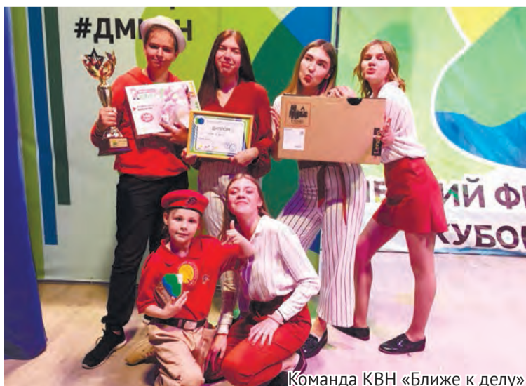
Команда КВН «Ближе к делу»

Сергей Светлаков подарил качканарцам ноутбук