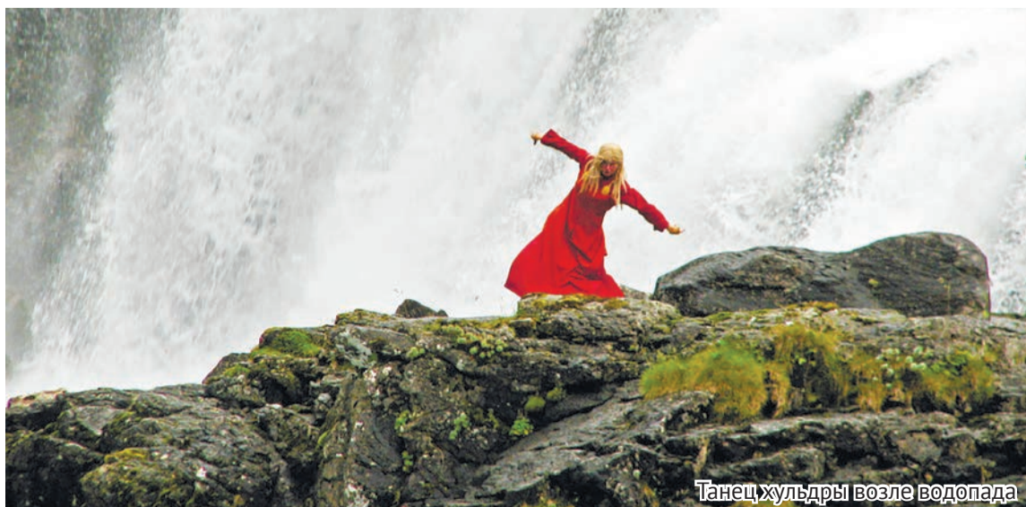
Танец хульдры возле водопада