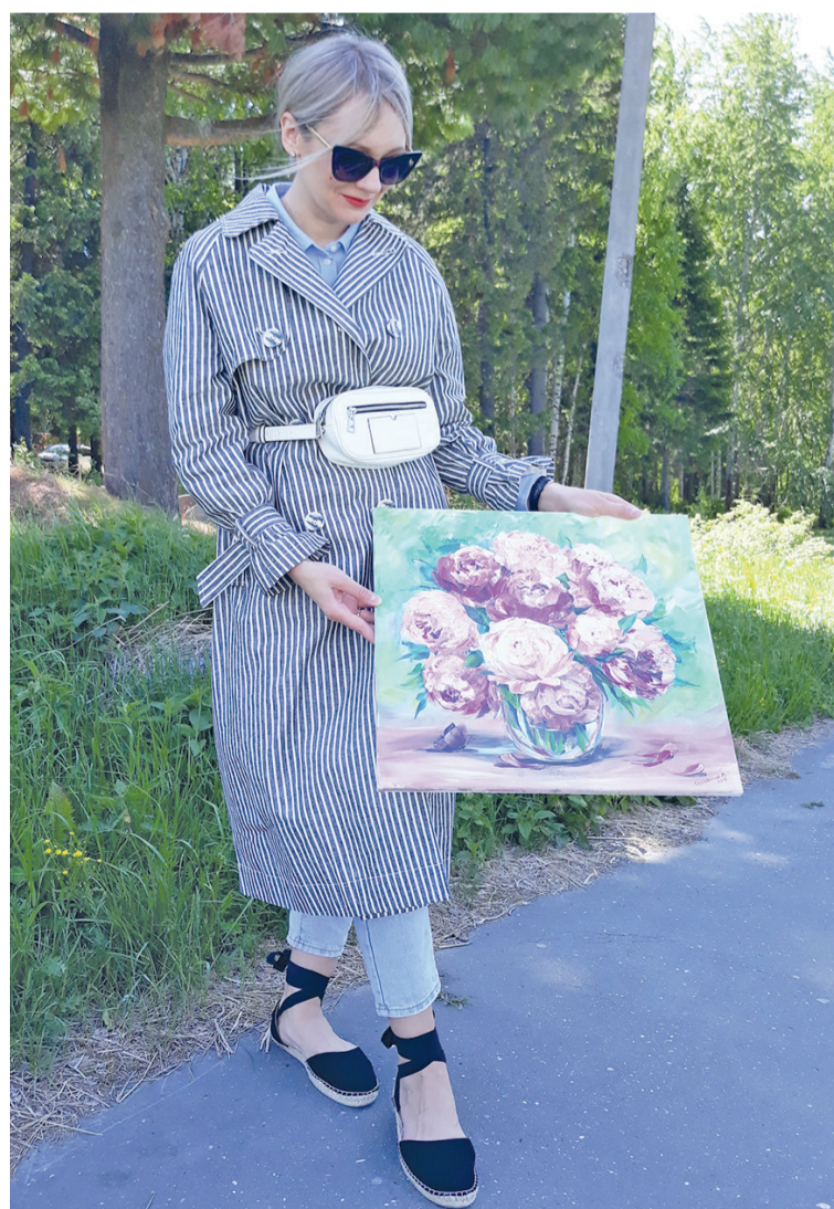
Вот такие пионы получились после двух дней отпуска