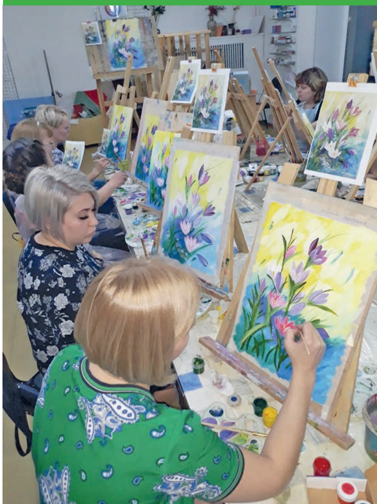
Найти время на себя в субботу вечером может не каждая женщина!

У каждого свое препятствие: кто-то не может нарисовать ровную линию. Я ему объясняю способ, как это сделать. Кто-то не может получить нужный оттенок и из каких составляющих. Я на своих мастер-классах объясняю, как добиться нужного оттенка. И так далее.