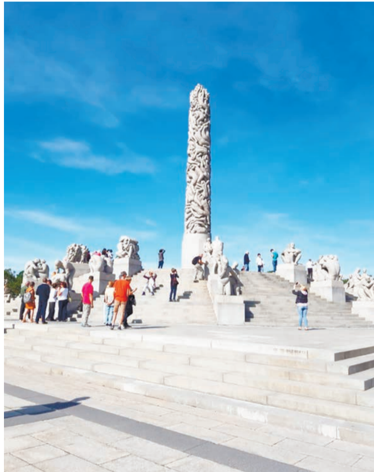
Скульптура «Монолит» в парке Вигеланда