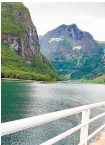
По дороге к водопадам

растущая на крыше, — это такая фишка здешних мест.