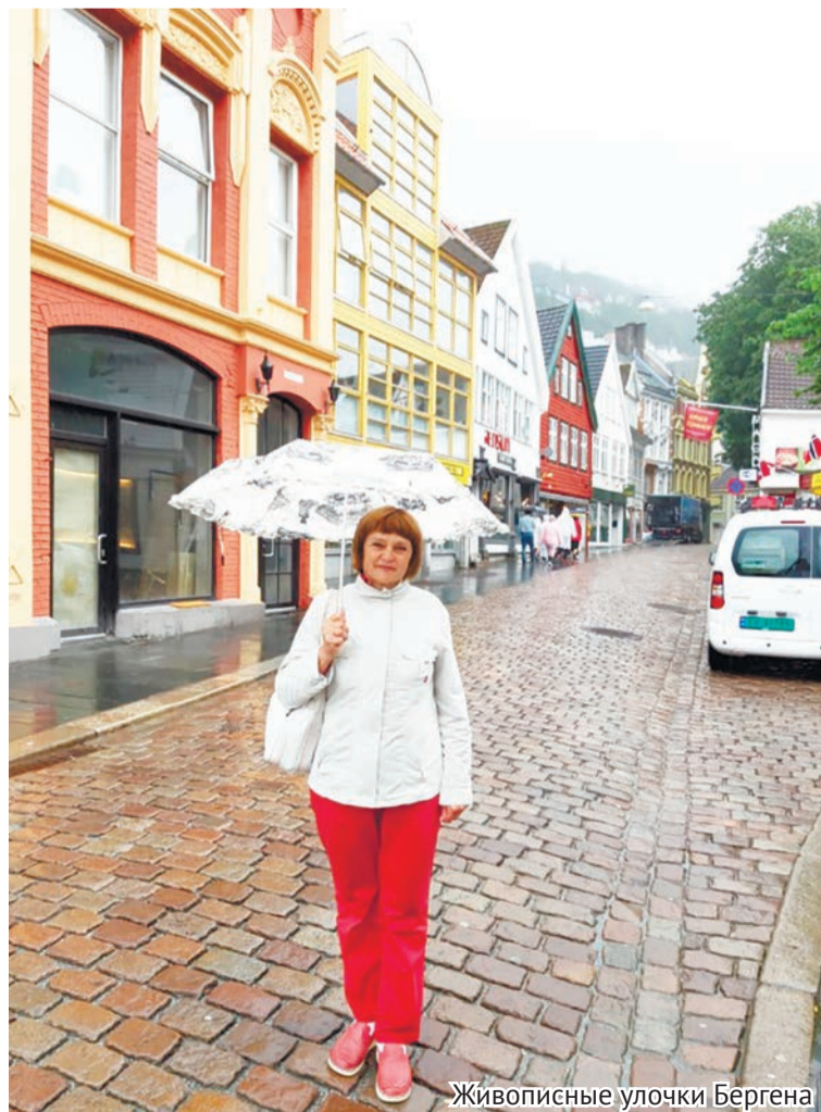
Живописные улочки Бергена