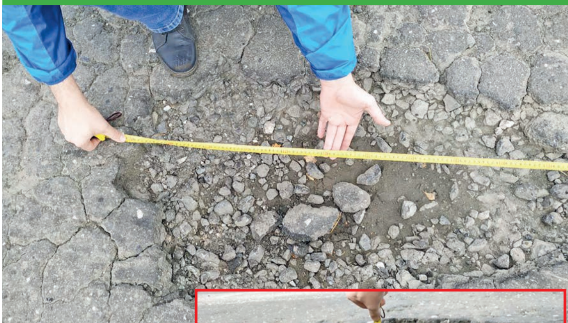
Таких огромных ям на дороге не должно быть

Отдельное повреждение (выбоина, просадка, пролом) длиной 15 сантиметров и более, глубиной 5 сантиметров и более и площадью больше 0,06 метров квадратных .