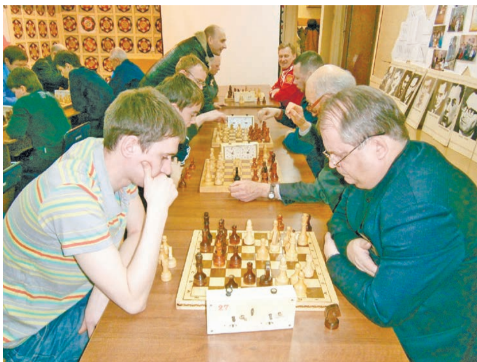
Михаилу (он слева) интересно не только самому играть в шахматы, но и учить этому других

— В шахматный спорт я прошел довольно поздно, когда мне было 15