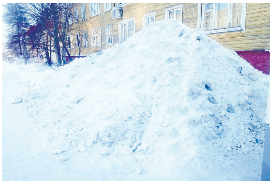
Глядя на горы снега, доходящие порой до окон, с трудом верится, что из города регулярно вывозится снег, даже хотя бы с центральной улицы

Напомним, что в 2019 году УГХ уже заключало контракт, чтобы вывезти убранный снег. Его стоимость – 965 тысяч 237 рублей. Получается, что почти миллиона рублей не хватило на запланированные цели.