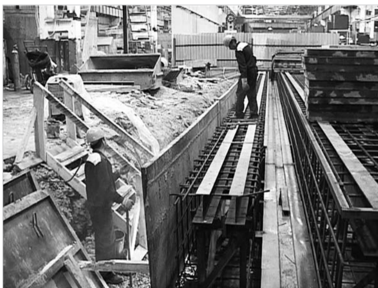
Фундамент для станка CINCINNATI сложный и дорогой