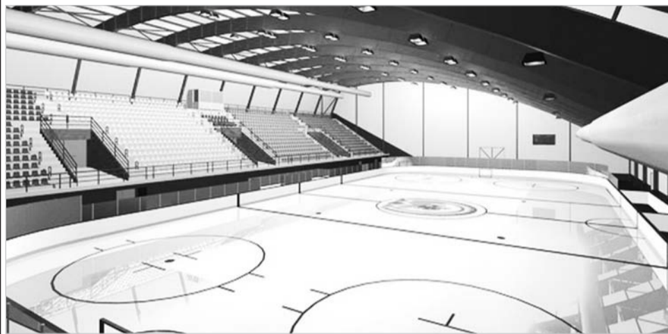
Когда-нибудь и у нас будет так же

Говорят, обещанного три года ждут... Третий год подрядчики пермской фирмы с солидным и труднопроизносимым названием «ОблСнабСтройСервис» продолжают строительство воздухоопорного сооружения с искусственным льдом на стадионе «Старт». Но пока не видно ни конца ни края. На сегодняшний день проведена канализация и сделаны полы под конструкции будущих трибун, работает система вентиляции, проложен первый слой тёплых труб, которые будут отогревать грунт, и подготовлено место для холодильного оборудования. Но на коньки вставить ещё рано!