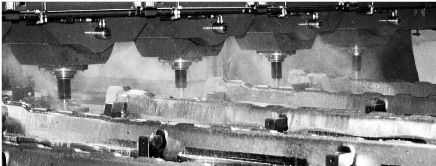
У оборудования нет выходных