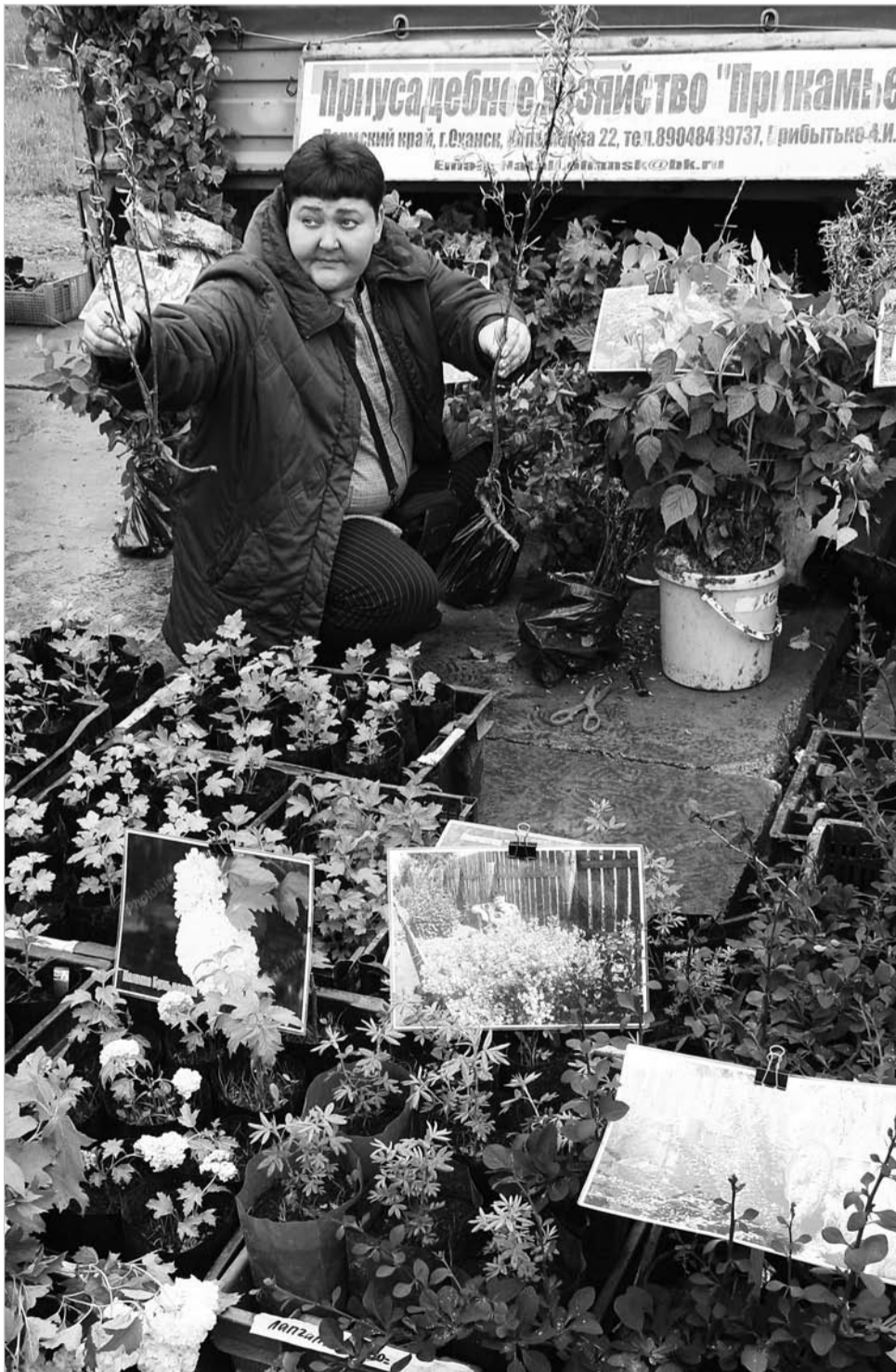
Подходи, торопись, в саду работать не ленись!