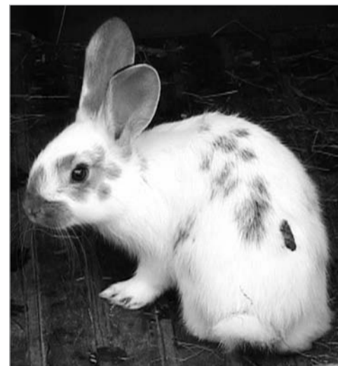
Не только ценный мех, но и положительные эмоции