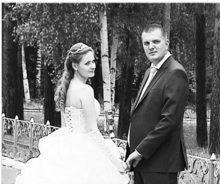
От гарнисажек отвлекла только свадьба... и то ненадолго