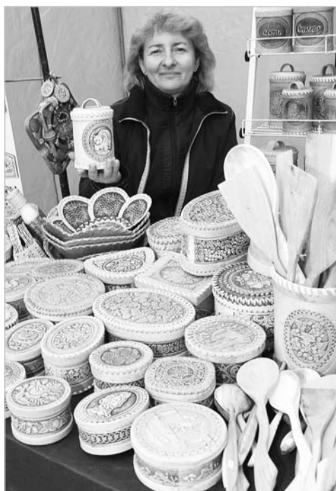
Творенье рук уральских мастеров