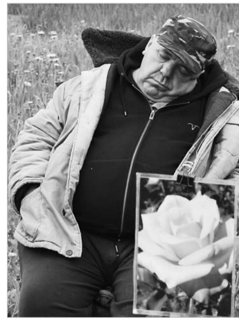
Когда товар продан...

Шкатулки и тески из бересты, бусы из поделочных камней и многое другое предлагали мастера народных ремёсел. Продавцы в медовых палатках также норовили угодить разборчивым салдинским покупателям. А чтобы те не растерялись от многообразия выбора – держали под рукой мёд из пустырника. И всё это – под весёлое пение петухов, кудахтанье кур, писк утят, крик перепелов. Э-эх, хороша русская ярмарка!