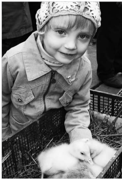
Мама, купи утёнка!