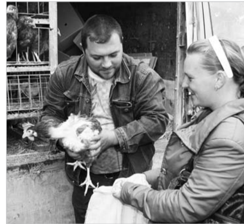
Заведём с тобой мы курочку. А петуха?!