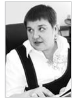
Рубрику ведёт Элла ПАВЛОВА телефон 6-00-87