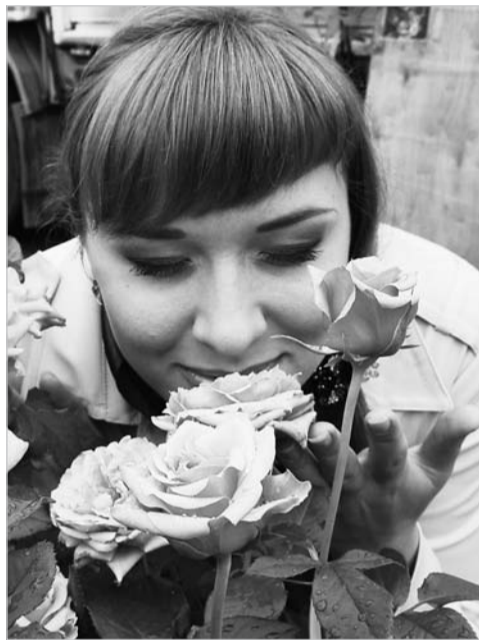
Аромат цветов манит, но от цен кошель трещит

От пёстрых петуний и грациозных роз до забавных пушистых утят и крикливых петухов – таков ассортимент сельскохозяйственной ярмарки, которая в очередной раз прошла в Верхней Салде в минувшую пятницу. На площадке около городской бани, уже привычном месте проведения ярмарки, свой товар наперебой предлагали 40 продавцов, со всех концов Уральского региона.