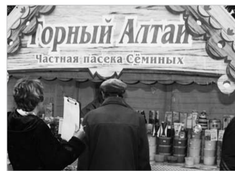
На ярмарке был, мёд, пиво пил