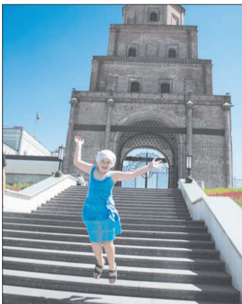
Елизавете вообще всё понравилось

Елена НАЗАРЫЧЕВА