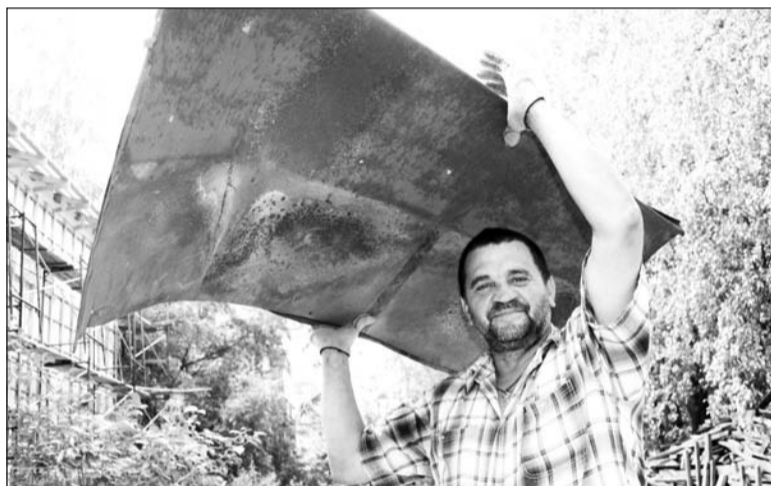
Теперь крыша будет не грязно-ржавого, а светло-зелёного цвета

В этом году на ремонт здания института Корпорация выделила 7 миллионов 748 тысяч рублей