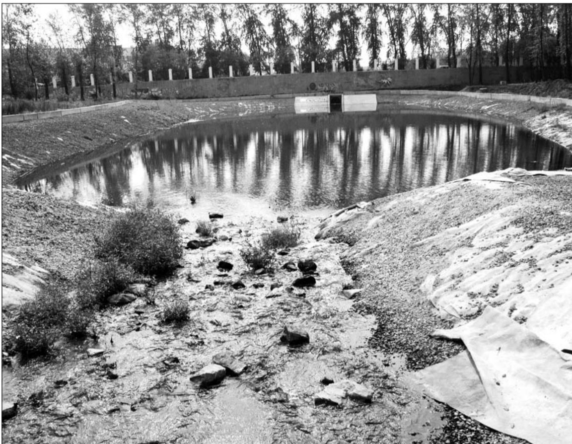
А без денег и труда не получим мы пруда

Именно по моей инициативе этот двор и дома будут огорожены. Знаю, что салдинская общественность неоднозначно относится к возводимому забору и охране, но живём мы не в Швейцарии, где граждане ходят по проложенным дорожкам, а не протаптывают новые. Поэтому без охраны дворы новых домов могут остаться без лавочек и детской площадки... Конечно, когда-нибудь наступит время, что заборов делать не надо будет и в каждом сал-