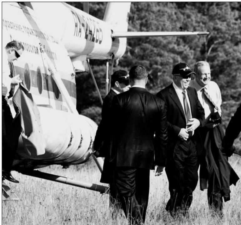
Полёт до Салды прошёл успешно