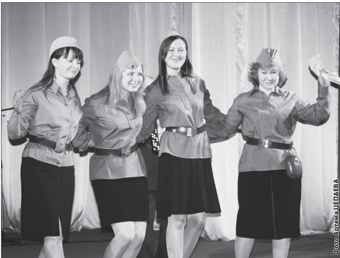
Сюрприз для читателей: песня военных корреспондентов в исполнении сотрудниц «Городского вестника»

«Газета – первый черновик истории», – говорил в начале прошлого века издатель Филип Грэм. Газета пишет историю своего города, своей страны. Историю своего города нижнесалдинская газета «Городской вестник» начала писать 10 лет назад. Для читателя 10 лет – это 1545800 строчек, 15640 газетных материалов, более пяти тысяч иллюстраций и тысячи ответов на вопросы из разных сфер деятельности человека.