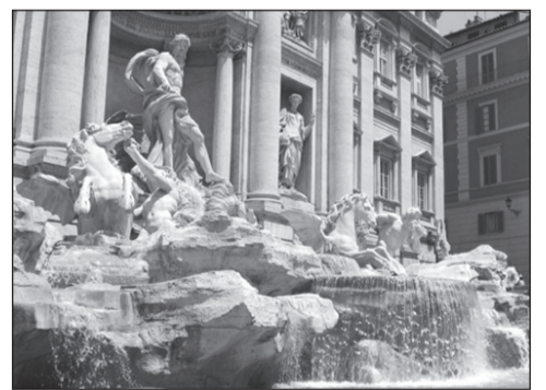
Фонтан Треви в Риме