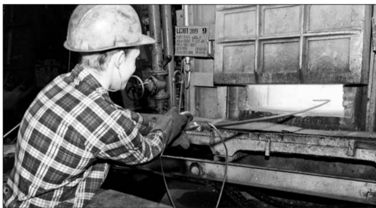
Как пирог из печи

Чем похвастались из нового оборудования? Долгожданной установкой гидроабразивной резки «УГАР» и погрузчиком «Глама!» Робот-манипулятор был приобретён в этом году и здорово облегчил труд кузнецов. Он обслуживает два ковочных молота, подаёт заготовку из газовых печей. Раньше этот процесс производился