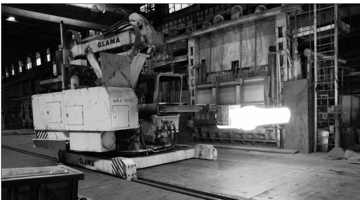
«Глама» – первый помощник кузнецам