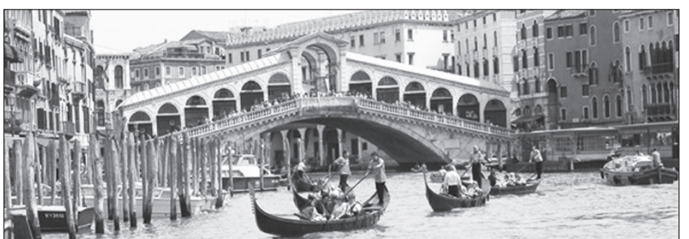
Мост Риальто в Венеции