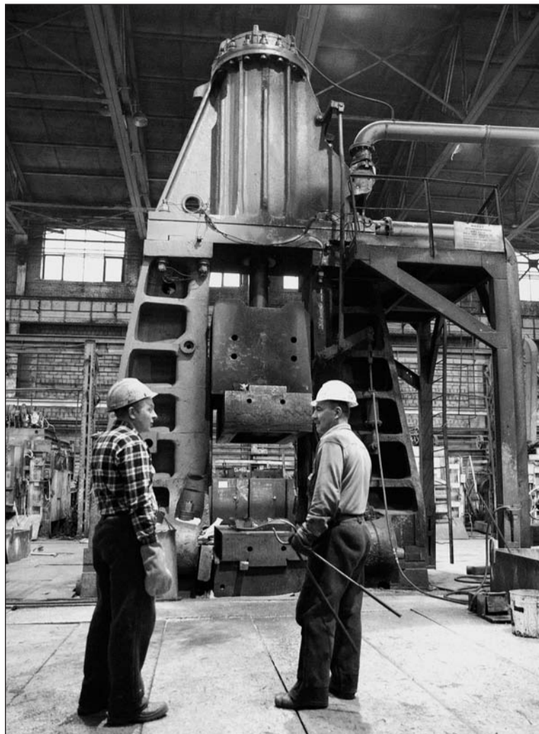
Оборудование в кузнечном уникальное – старинное