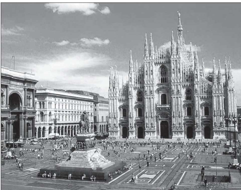
Дуомский собор в Милане