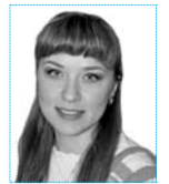
Рубрику ведёт Яна ГОРЛАНОВА телефон 6-21-90