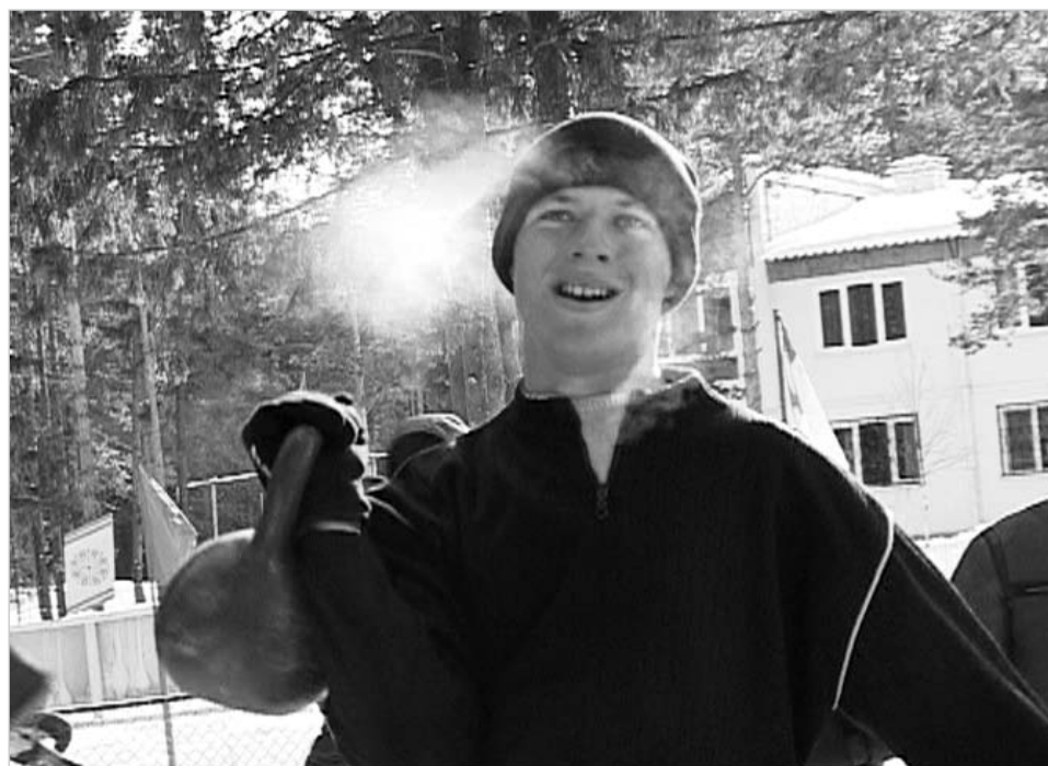
Вес любой по плечу!