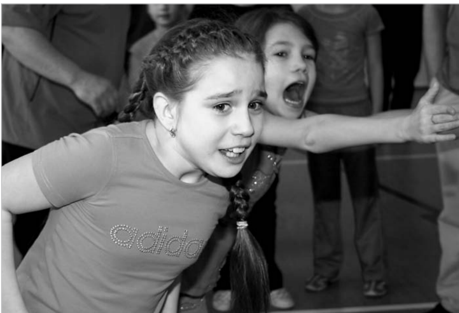
Хорошая поддержка – половина успеха