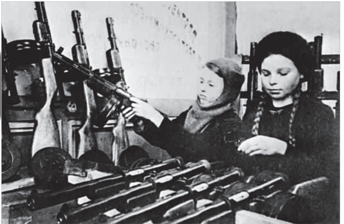
Маленькие героини трудового фронта. 1942 год