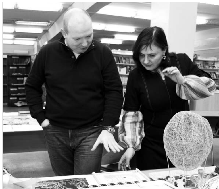
Трудный выбор жюри