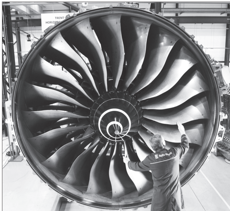
Двигатель Rolls-Royce Trent 1000 для Boeing 787

Никто из членов заводского персонала никогда не скажет: «Rolls-Royce сломался». Вместо этого вы услышите: «Rolls-Royce отказывается продолжать функционировать».