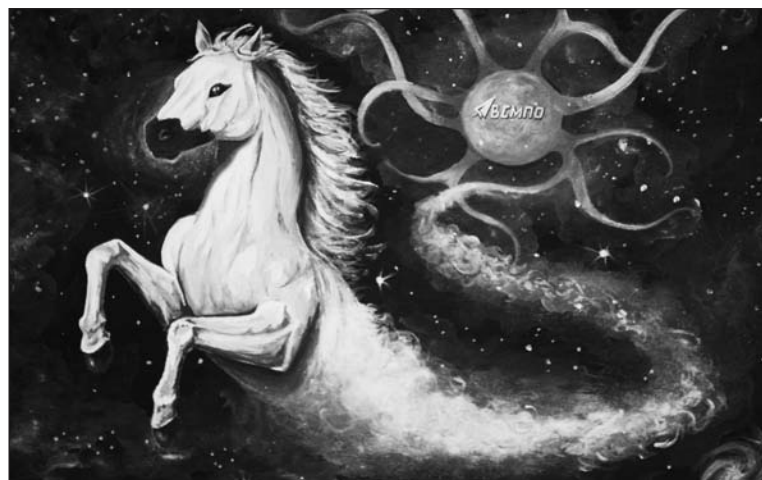
Полёт к победе