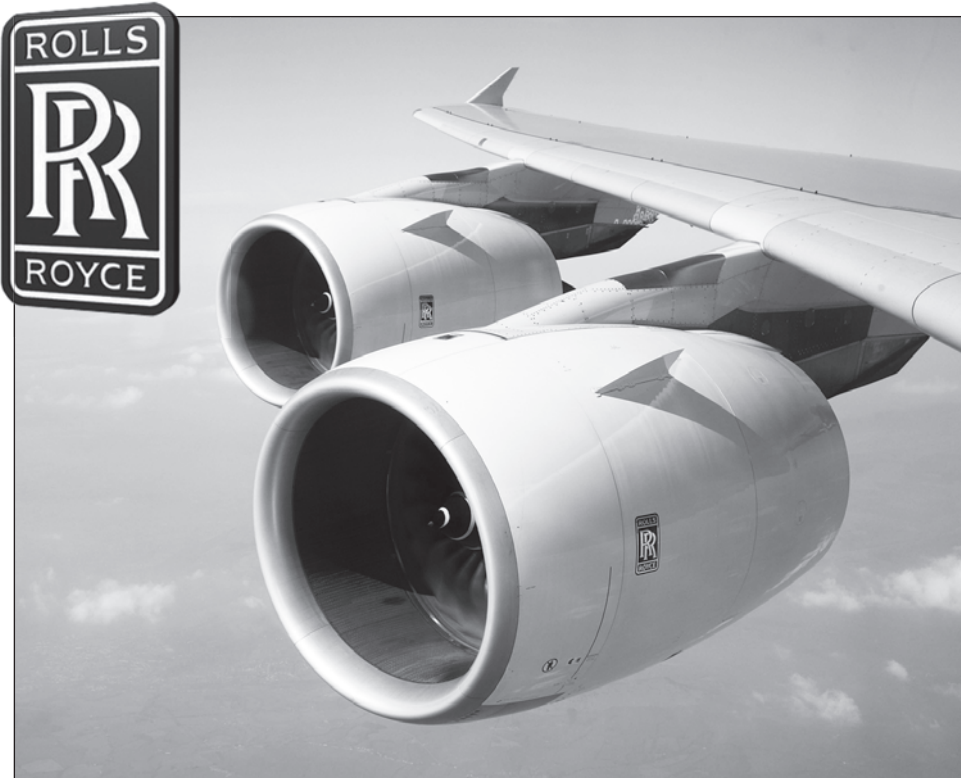
Двигатель Trent 900 на Airbus A380

Автомобили компании никогда не отличались дешёвизной, и ценовая политика, сформулированная Ройсом, актуальна и сегодня: «Качество остаётся, когда о цене уже давно забыли».