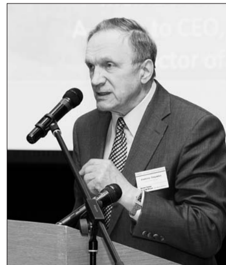
Владислав Тетюхин: «Наши технологии – лучшие в мире»