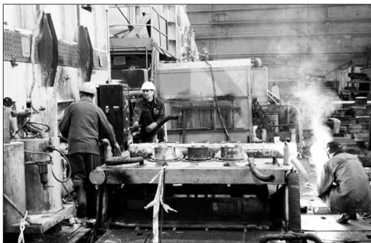
Заканчивается ремонт литейной машины