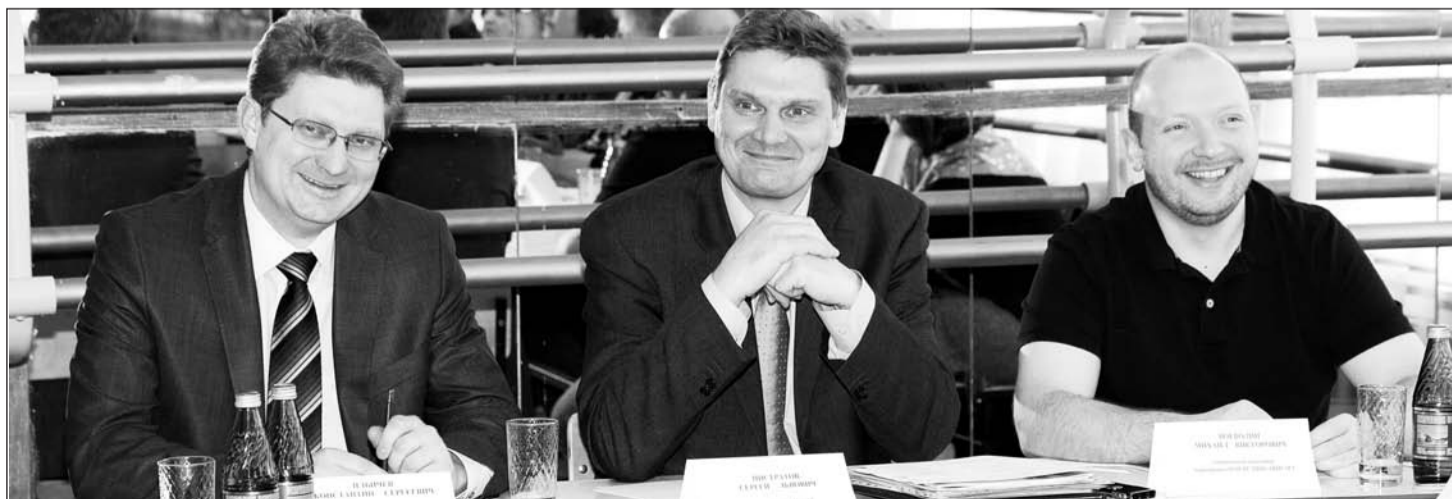
Несмотря на серьёзность проблем культуры, доклады у гостей круглого стола вызвали положительные эмоции, потому что представляли их обаятельные женщины – руководители учреждений культуры