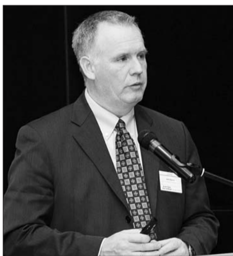
Джон Бёрн: «BOEING готов расширить диапазон российских проектов»