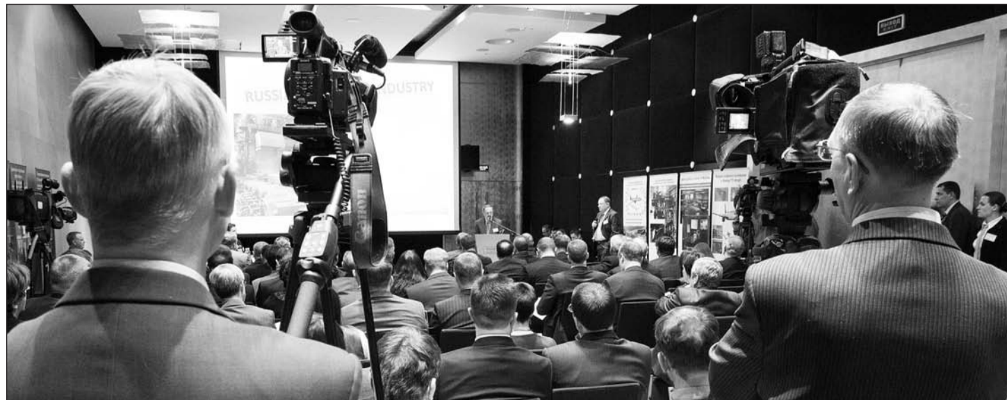
В большом зале гостиницы «Хаят» свободных мест не было. Такой бы аншлаг в «Титановой долине!»