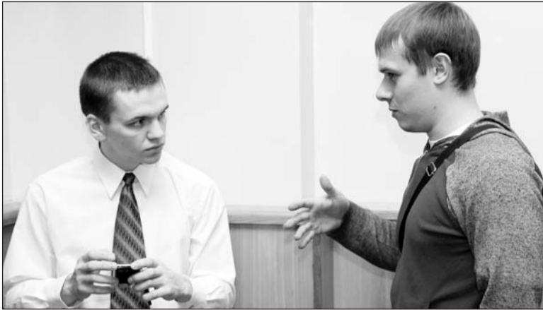
Обсуждение докладов продолжалось в кулуарах