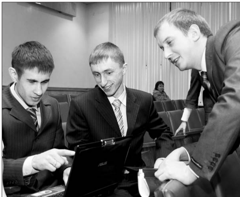
Графики, таблицы, тезисы – в компьютере, остальное – в голове