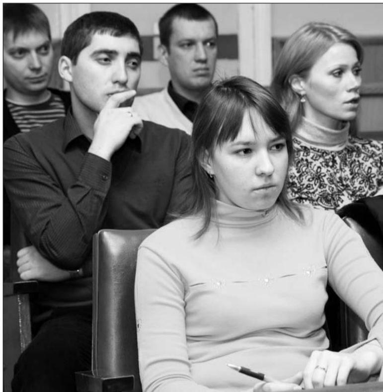
Самые интересные выступления слушали с особым вниманием