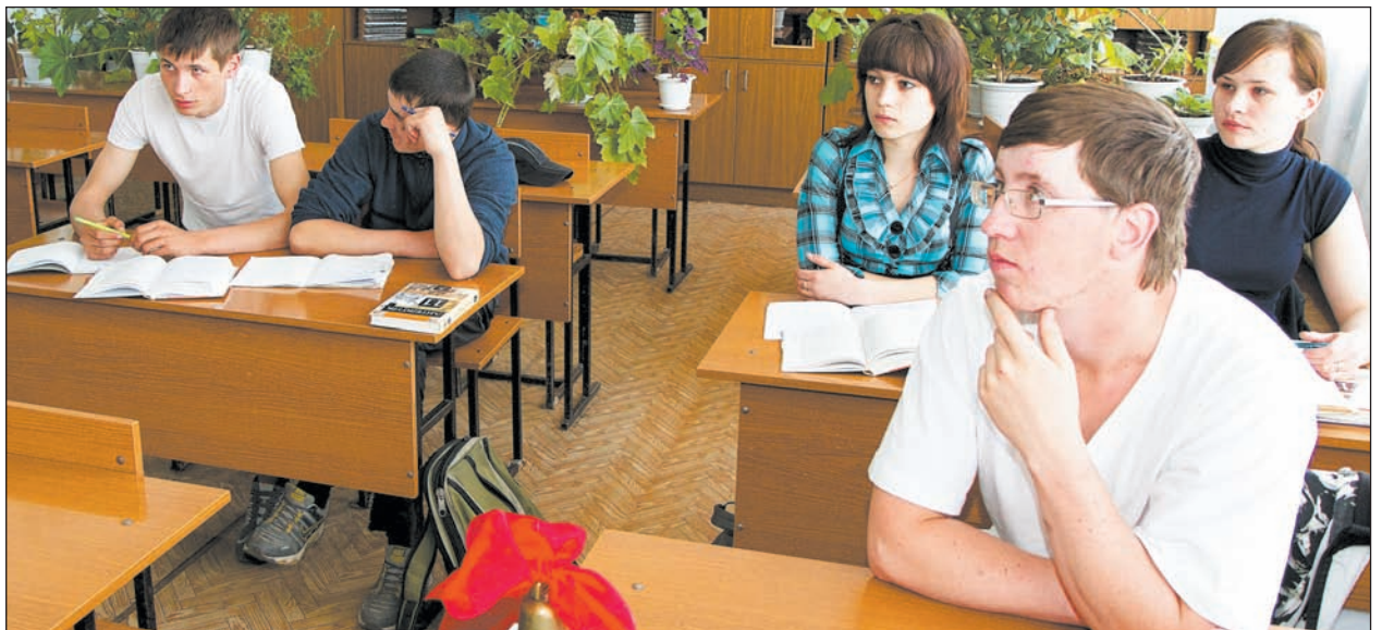
С первого класса за одной партой