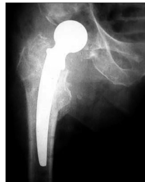
Протез тазобедренного сустава на рентгенограмме

Aescular – компетентный партнёр стоматологов. Компания В. Braun Aescu-