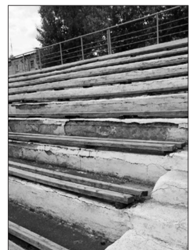
Трибуны подождут до лучших времён