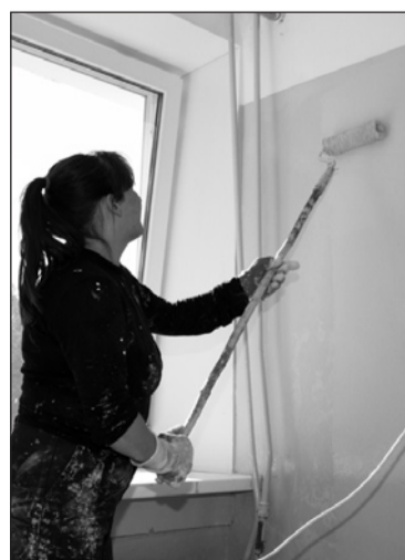
Благоустройство и в «Тирусе», и в «Престиже»