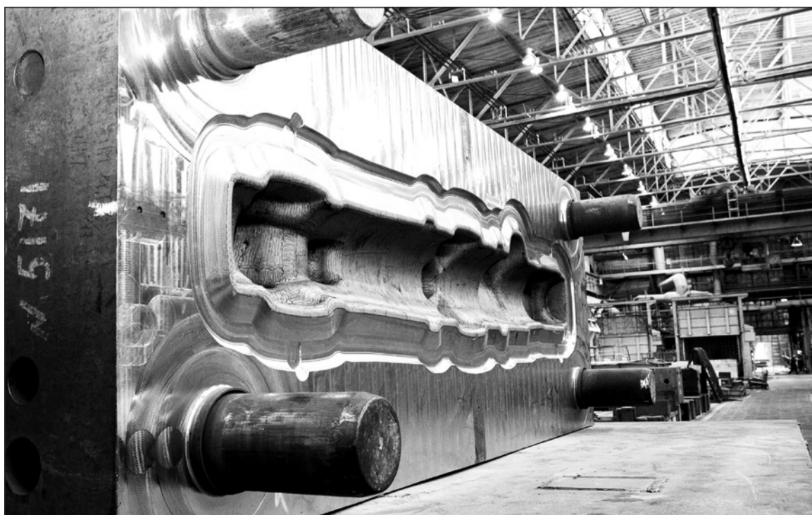
Огромный штамп для производства заготовки стойки шасси Boeing отполирован и упрочнён плазменным покрытием