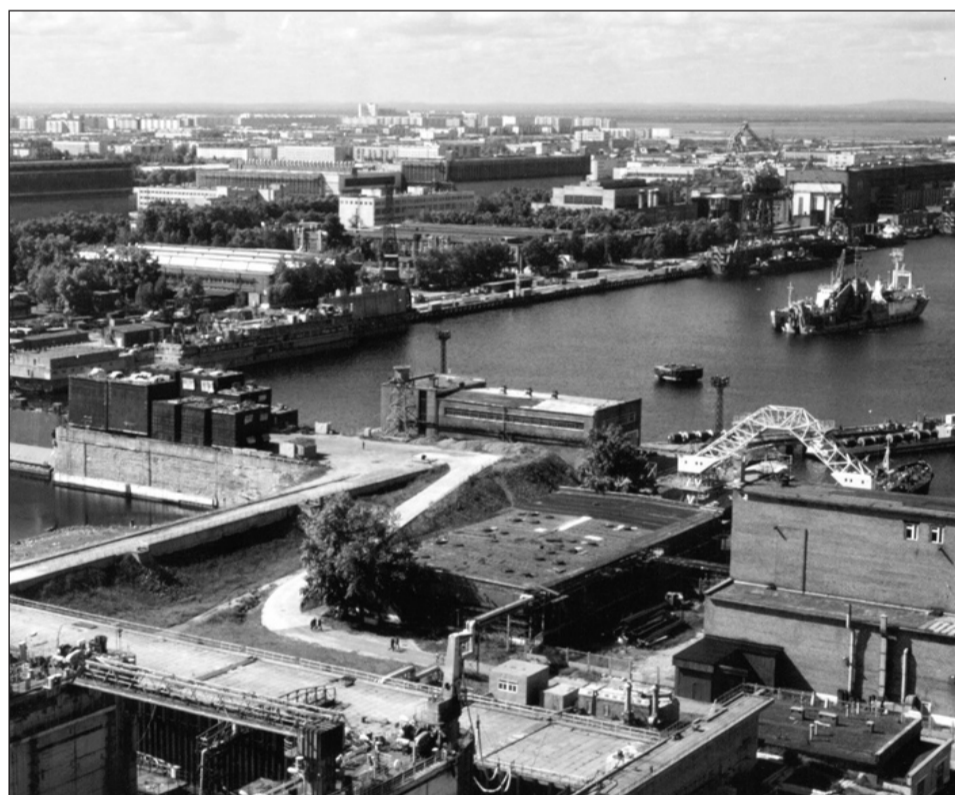
«Севмаш», г. Северодвинск

на которых может размещаться буровое, энергетическое и другое оборудование. Приоритетным проектом считается создание объектов для разработки Штокмановского газоконденсатного месторождения в Баренцевом море.