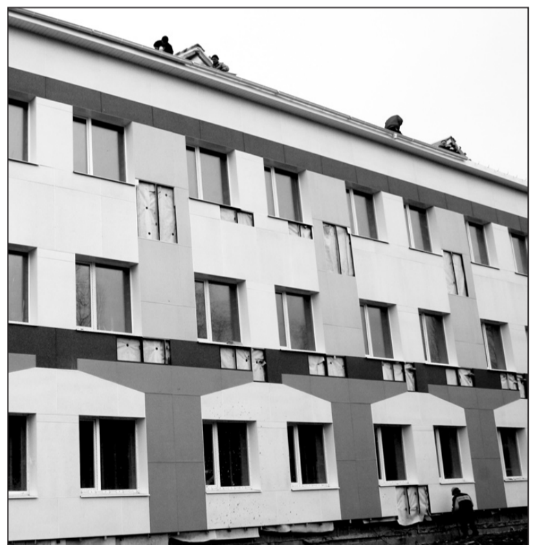
Самые большие инвестиции – в роддом