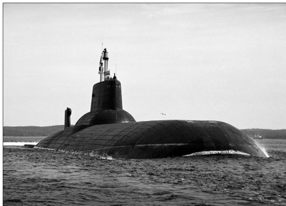
Подводный крейсер-ракетносец «Дмитрий Донской». Длина 172 м, ширина 23,3 м

Приоритет в выпуске гражданской продукции отдан проектам освоения месторождений нефти и газа на шельфе Арктики. В завершающую стадию вступает строительство первой российской морской ледостойкой стационарной платформы «Приразломная» – уникального сооружения для работы в Печорском море. В 2007-2008 годах построены и сданы две плавучие полупогружные платформы MOSS CS50 для компании «Moss Mosvold Platforms AS» (Норвегия),