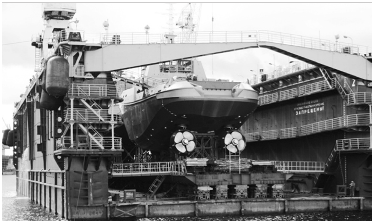
Ледокольный противопожарный буксир

Со дня основания до 1917 года на верфи было построено более 1000 судов и кораблей. Среди них: 137 крупных парусных военных кораблей, около 700 средних, малых парусных и гребных судов, более 100 металлических кораблей, в том числе 25 броненосцев, 8 крейсеров 1-го ранга. По числу и качеству построенных кораблей в России в те годы не было верфи, равной «Адмиралтейству».