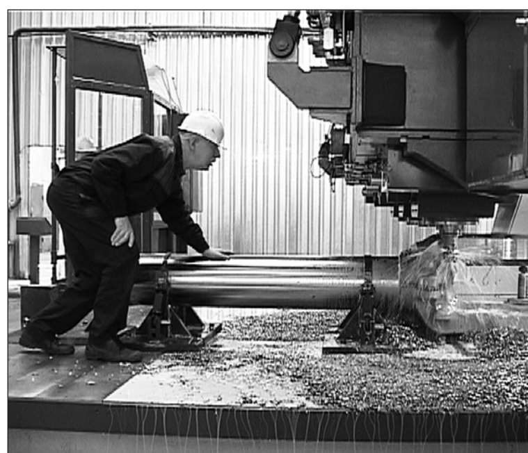
Механическая обработка бутафорной заготовки детали шасси Boeing 787 прошла успешно

Но кроме монтажа, запуска, эксплуатации сложнейших агрегатов, у начальника цеха есть ещё одна высокая цель, в прямом смысле этого слова – ремонт крыши. А это мероприятие, ох, какое непростое! Как-то не привыкли наши строители сверять свои кровельные планы с прогнозами синоптиков: бетонные плиты цеховой крыши освободили от рубероида аккуратно перед проливными дождями. Современные кровельные материалы подвезли с опозданием. И потекли ручьи сквозь трещины и швы в бетонном потолке, подмочив репута-