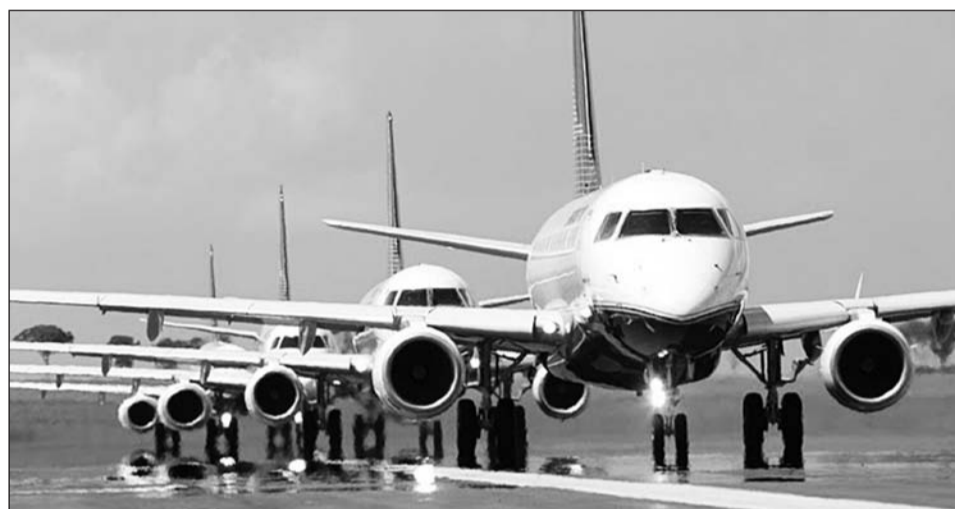
Либхерр поставляет полный комплект шасси для модельного ряда самолётов Embraer 170,190

Филиал авиакосмических и транспортных систем Liebherr был основан в 1960 году и обеспечивает рабочими местами почти 4 000 человек. Имеет три завода по изготовлению авиационного оборудования в Линденберге (Герма-