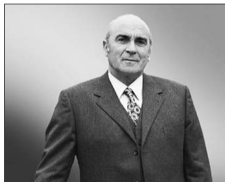
Ханс Либхерр (Hans Liebherr)