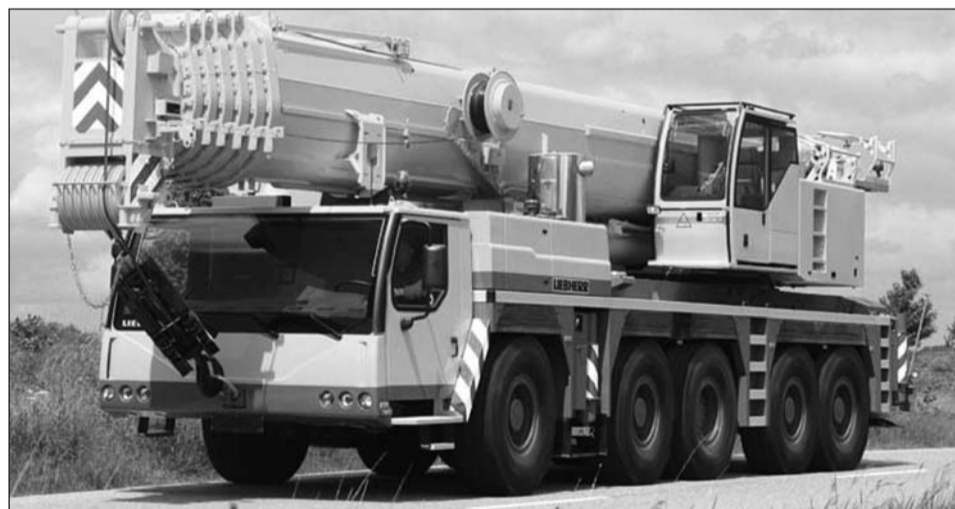
Вседорожный кран Liebherr

ния), Тулузе (Франция) и Гуаратингета (Бразилия).