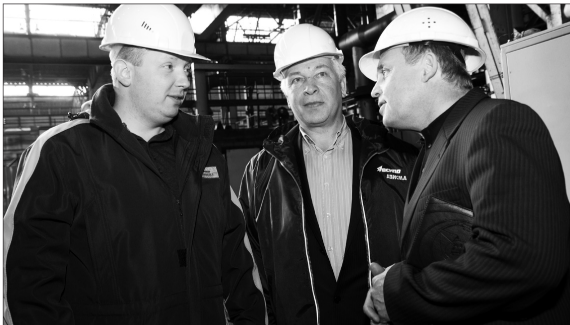
Генеральный и его первый зам в цехе № 21 – приоритетном объекте инвестиционной программы