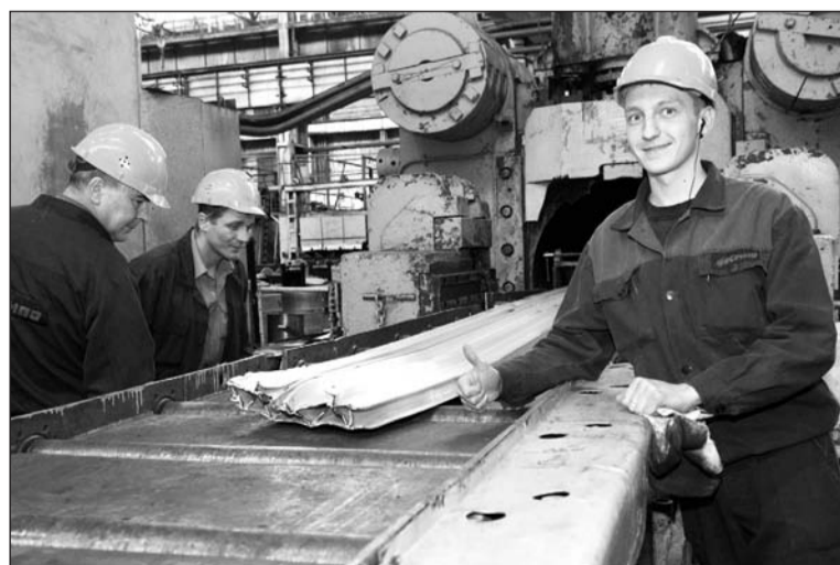
И вот она – полая панель сложного сечения для скоростных поездов. Получилось то, что надо!