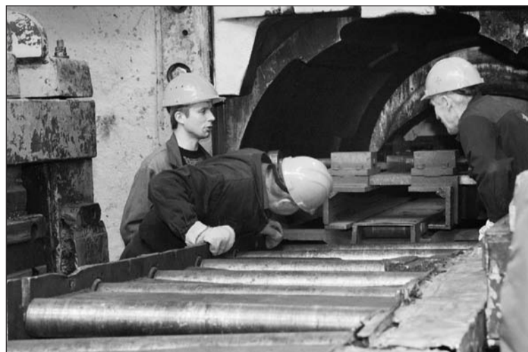
«Когда же, когда?» – прессовщики с нетерпением ждут появления готового изделия