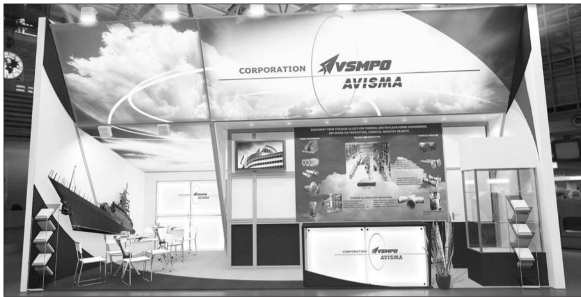
Вот такое дизайнерское решение по оформлению корпоративного стенда предложили сотрудники отдела № 55, готовясь к международной выставке Marintec China-2011 в Шанхае