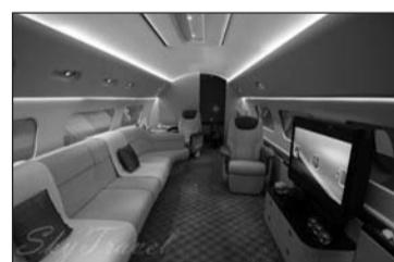
Embraer Lineage 1000