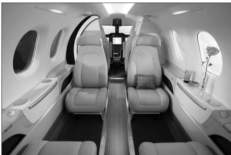
Phenom 100 предлагает комфортные условия своим пассажирам