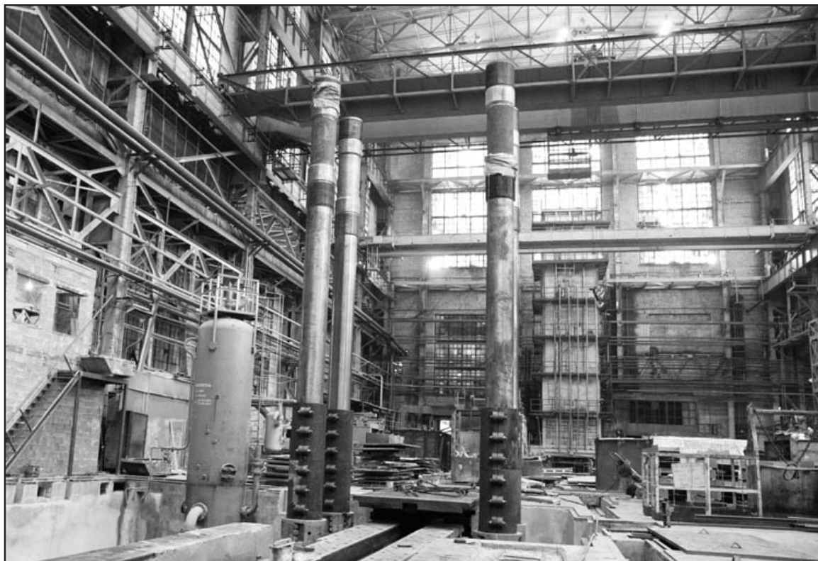
Новые колонны прессы обозначили его местонахождение