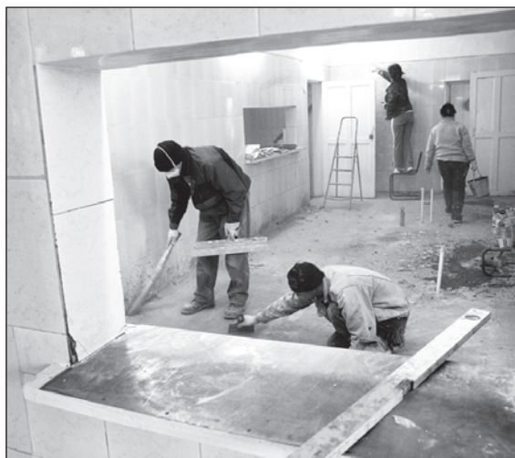
Строители – хозяева на кухне