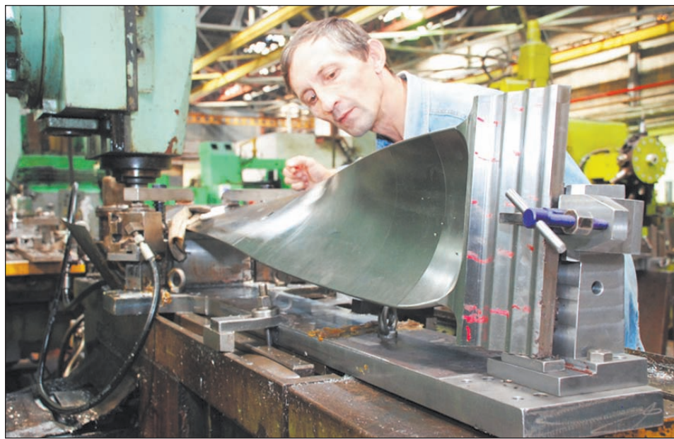
Титановая лопатка для турбины Новovoronezhской АЭС-2

работке гидрогенераторов для Волховской ГЭС.