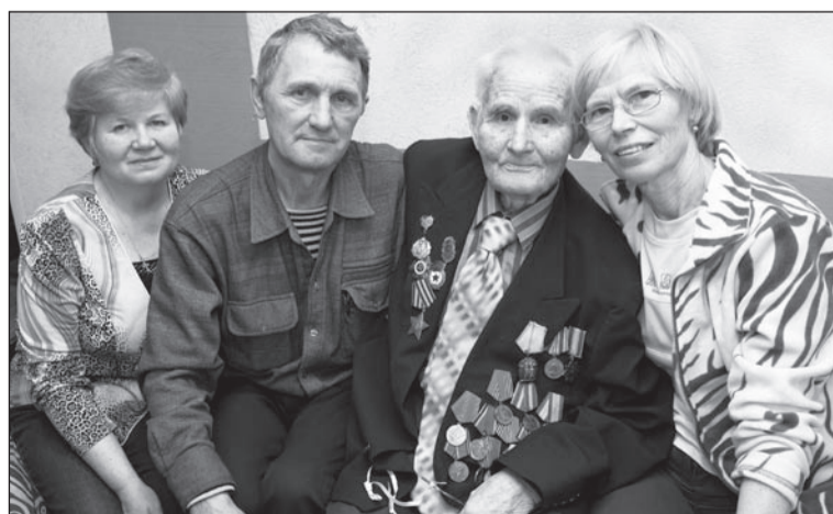
Тепло родного дома и любовь близких – лучший подарок к 9 Мая