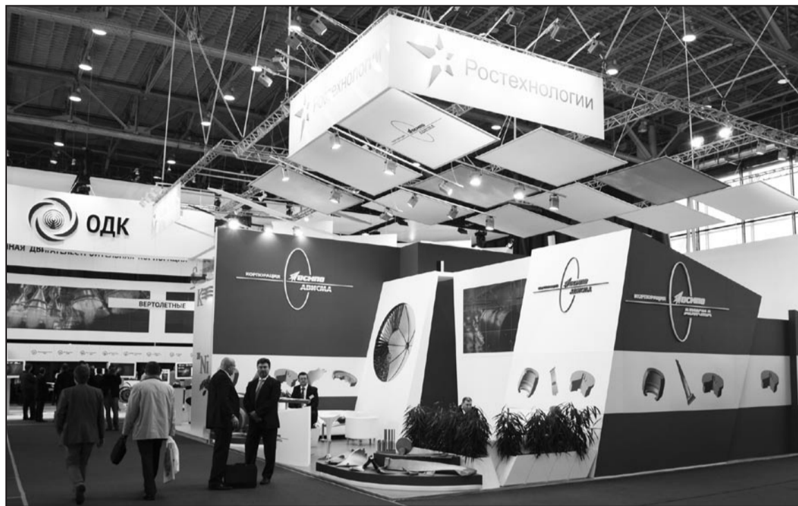
На стенде проведено более 40 встреч, и все – результативные

Международный салон «Двигатели» проводится один раз в два года. На сей раз на выставке свою продукцию представили не только производители двигателей, коих в России не так уж и много, но