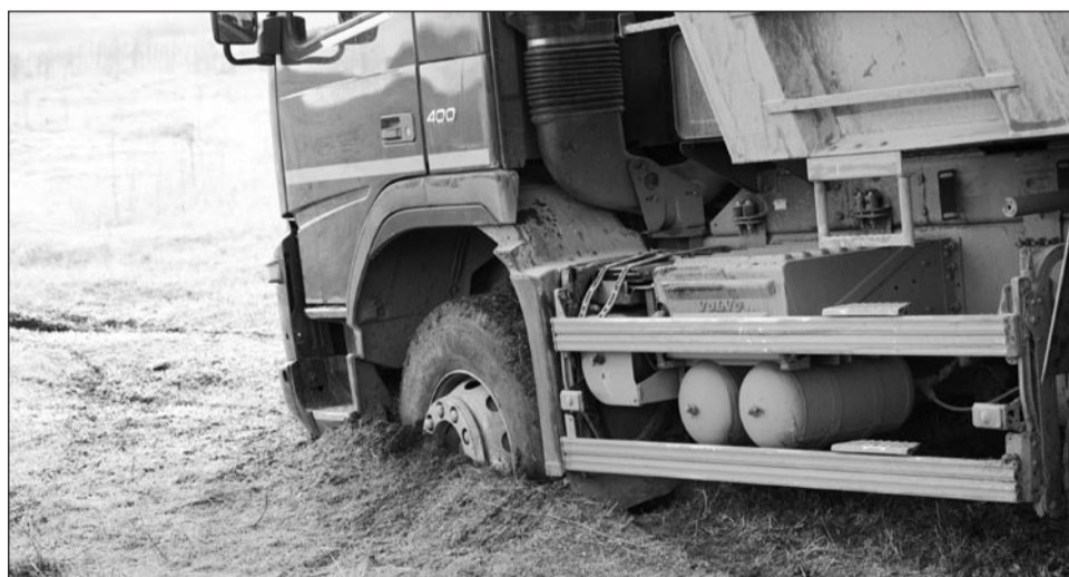
Это пока что не «Титановая долина», а настоящая трящина