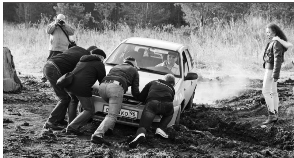
Надолго запомним, как всё начиналось