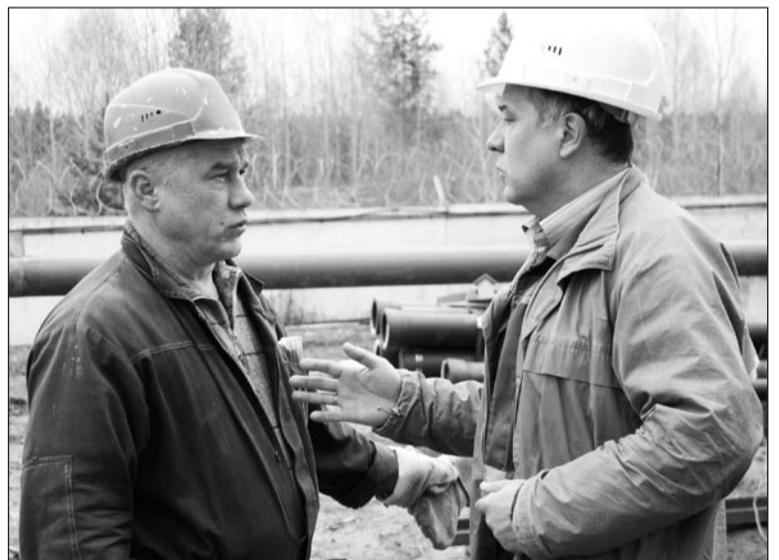
В споре рождается истина

серьёзная, ответственная и погрешностей не допускает. Всё должно быть сделано с точностью до миллиметра.