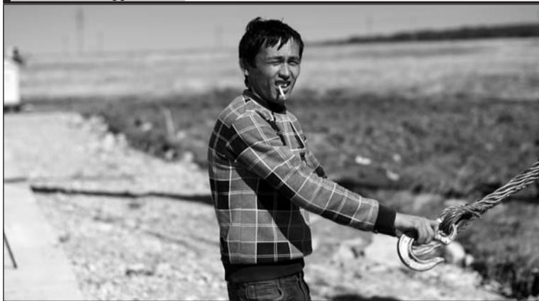
Долина – стройка интернациональная