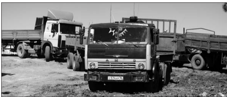
В Зоне – автомобильная пробка