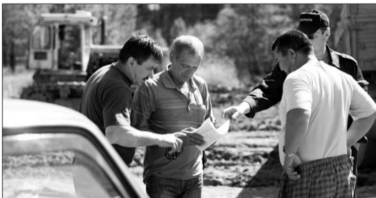
Разрядка работ десятого дня