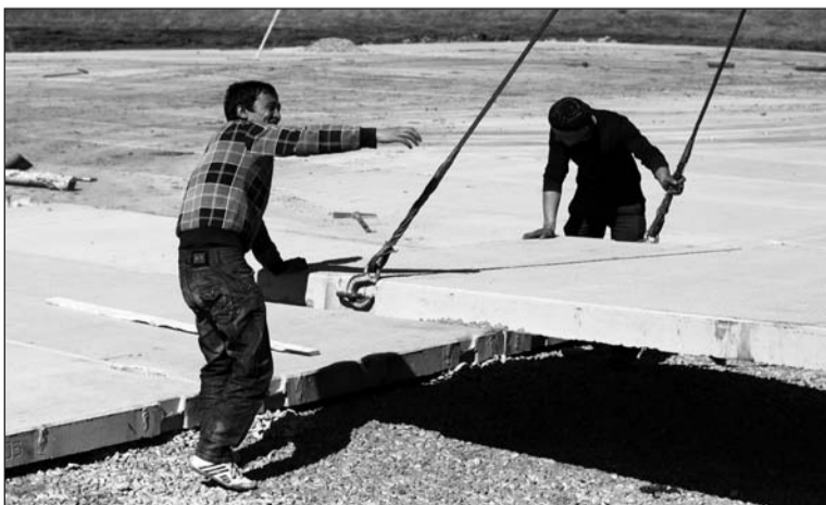
Вчера здесь было непаханое поле