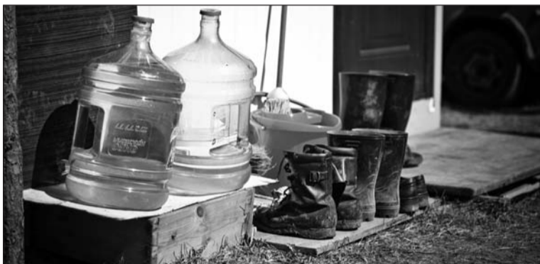
Нехитрые пожитки первопроходцев