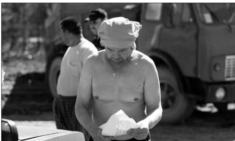
Долина Ферганская? Нет, Титановая!