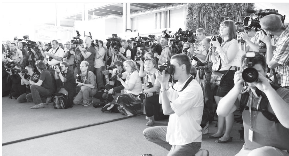
Самые любопытные посетители ИННОПРОМа – журналисты