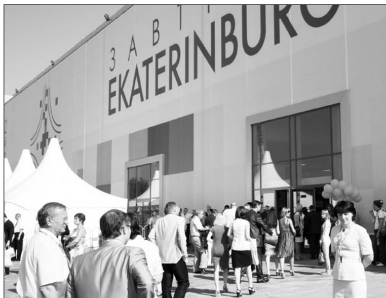
Отличительная черта ИННОПРОМа – очереди