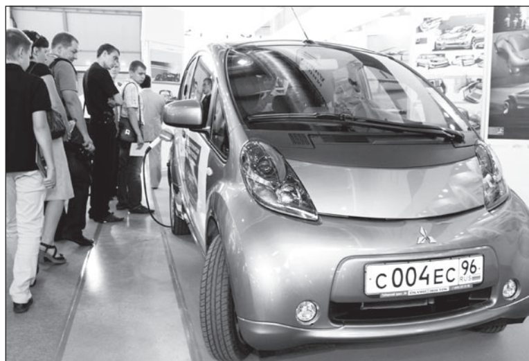
Первый уральский электромобиль