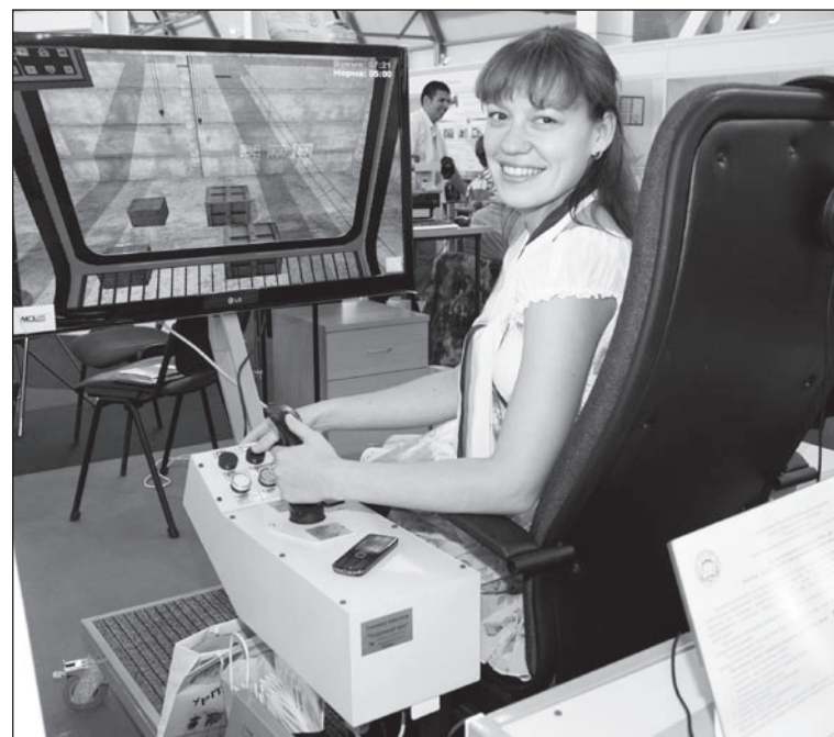
Салдинские лицеисты хвастались учебной кабиной крана