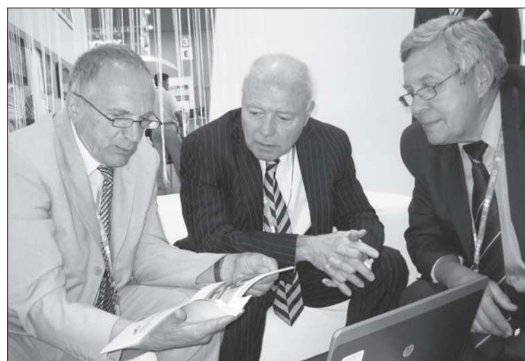
Американские вопросы российским металлургам