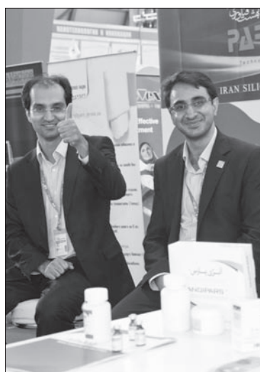
«Жарко, как дома!»