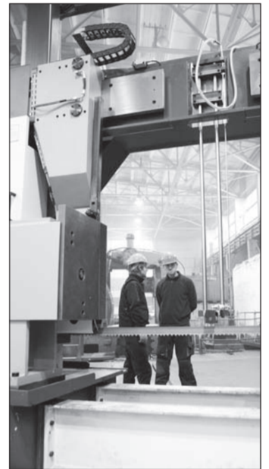
Пилу смонтировали за один рабочий день

После обеда ленточнопильный станок уже ювелирно подгоняли лебёдкой-«крокодил» к линиям разметки, а электрики готовились запитать новое оборудование электричеством.