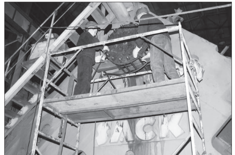
Ломать бывает сложнее, чем строить

Станину ЗАКа по частям вывезут на открытую площадку за цехом. Дальнейшая судьба радиально-ковочной машины решается в дирекциях по снабжению и сбыту.