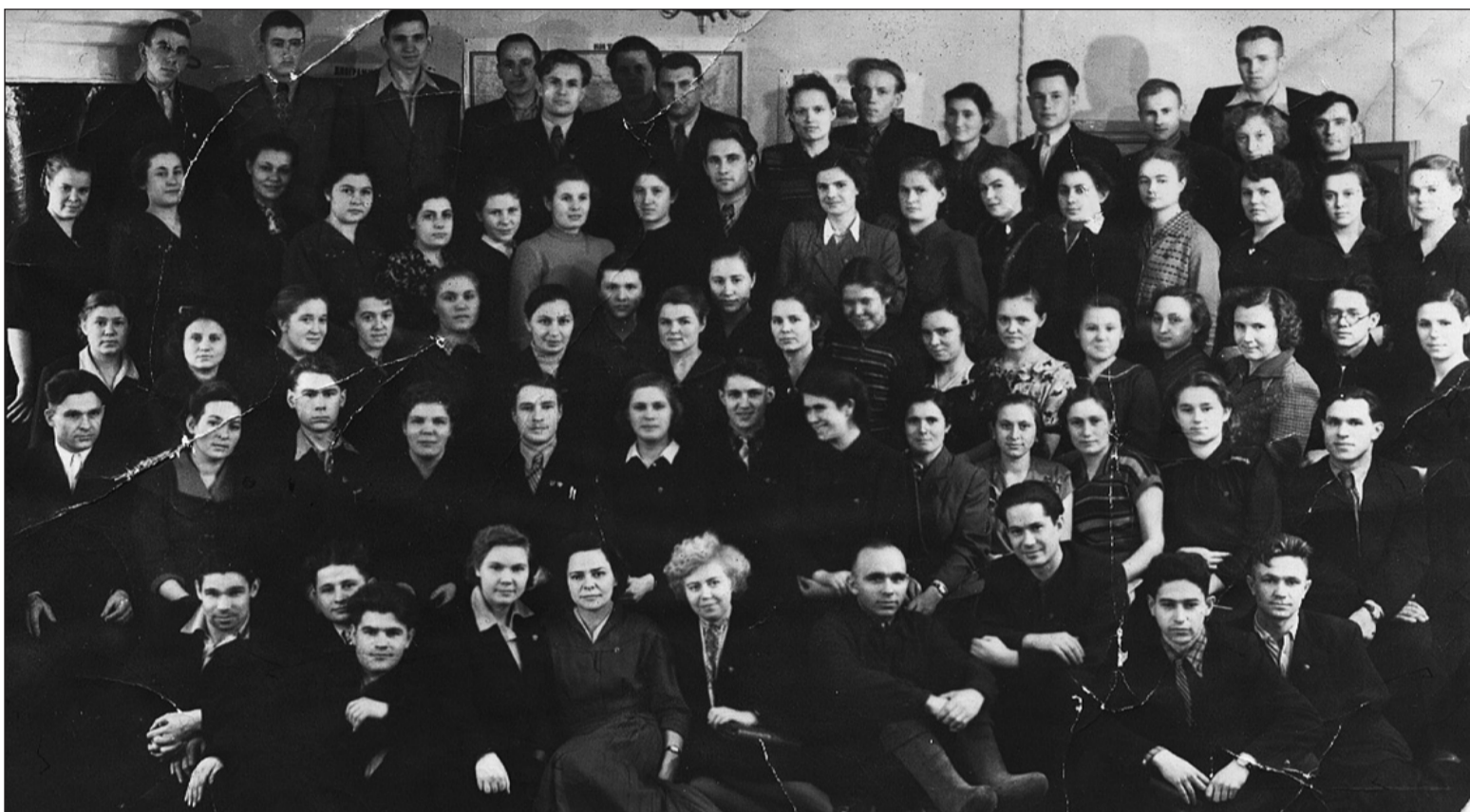
50-е годы. Семинар комсомольских секретарей Верхне- и Нижнесалдинского районов

– Представляете, приехала из Казахстана, уже месяц ищу работу и пока ноль. А здесь