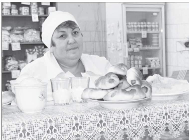
В столовой работников цеха по переработке отходов ждёт вкусный горячий обед