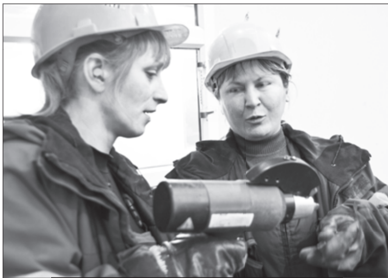
С помощью спектрометра контролёры точно определяют сплав металла