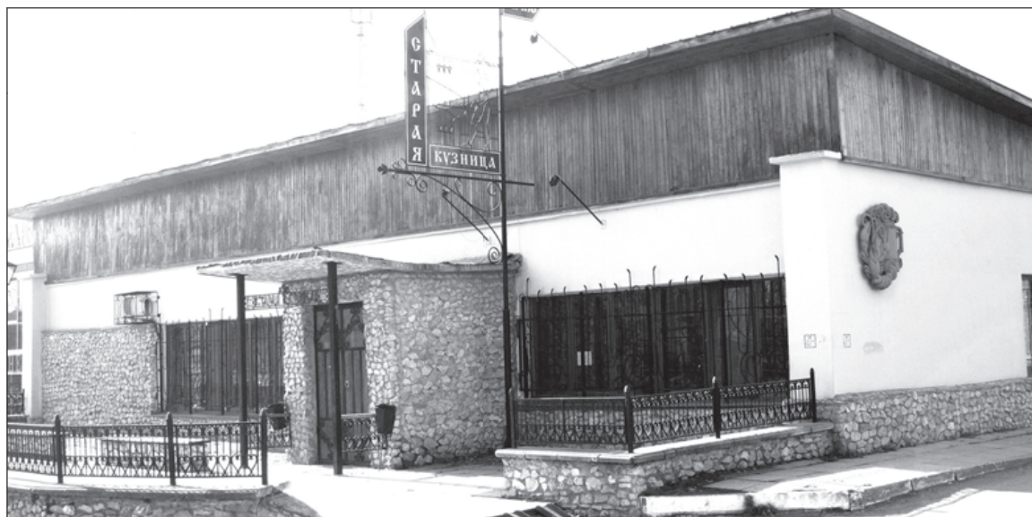
«Кузня» теперь не заводская