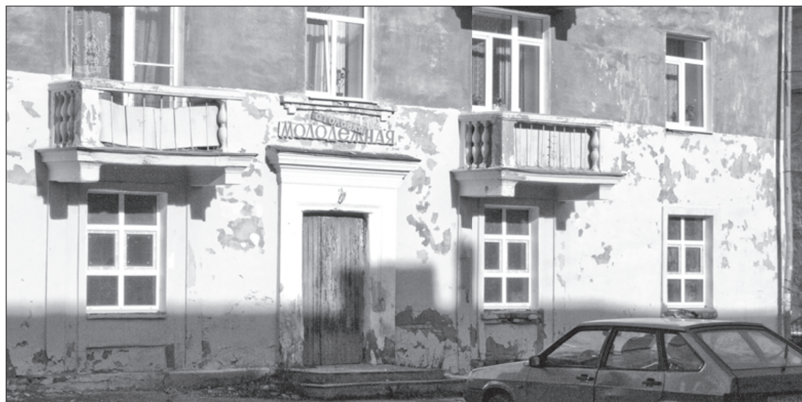
«Молодёжка» ждёт своего часа

Обсудив ещё ряд аспектов профсоюзной деятельности цехов, профком проголосовал, определил победителей смотра-конкурса. В первой группе цехов лучшей признана профсоюзная организация цеха № 21, во второй – переходящее знамя Центрального Комитета профсоюза получил цех № 23, в третьей группе лучшим признан цех № 29, в четвёртой группе первое место у цеха № 39 и в пятой группе переходящее знамя Центрального Комитета перешло цеху № 74 («Алюминиевый профиль»).