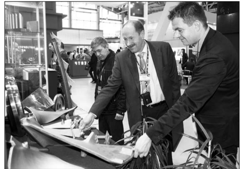
Как магнит, притягивает титан