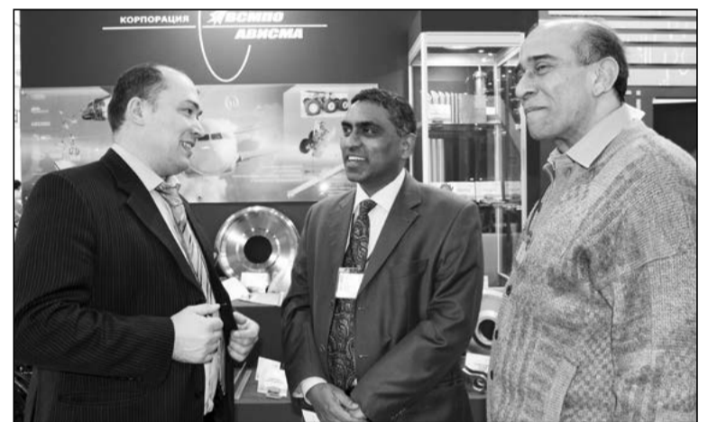
Российский титан – предмет желаний всех народов