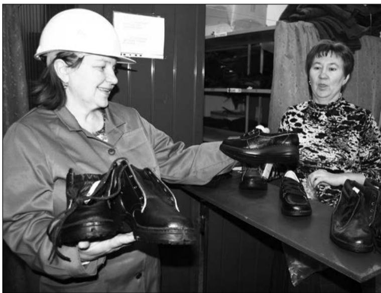
А так хочется ботиночки полегче

Со спецодеждой, вернее, с обеспечением, проблем тоже нет. Однако есть масса нареканий собственно к элементам спецовки: во всех проверенных цехах женщинам выдают «мужские» ботинки, громоздкие и тяжёлые. Все, как обычно, рассказывая об обуви, кивали в сторону контролёров, ножки которых обуты в лёгкие