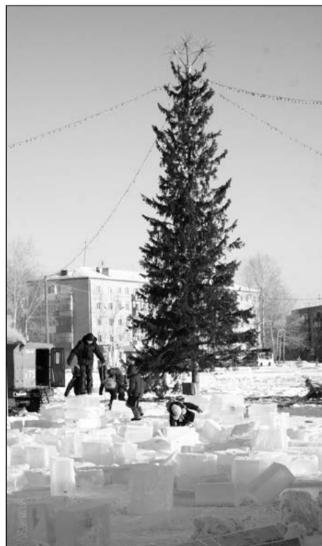
До открытия новогоднего городка осталось 6 дней

– Я готовилась к концу света в 2000 году – как-то уж серьёзно СМИ напутствовали всех! Думала, что после солнечного затмения реально наступит вечная темнота... Но ничего не было ведь! И 21.12.2012 года, звёзды, я думаю, будут работать в штатном режиме. А как же Олимпиада в Сочи? Вот её-то я жду! Не может же она после конца света быть!