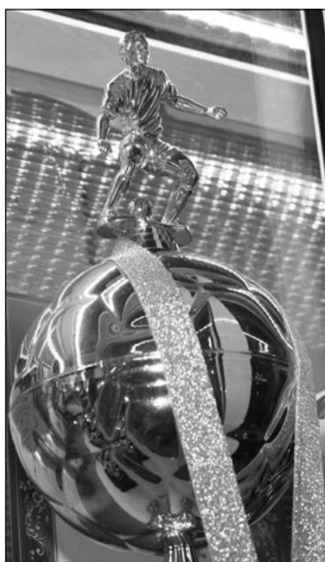
Один из 35 чемпионских кубков листопркатного