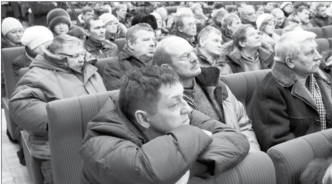
Более 200 бывших работников ЧЛЗ пришли добиваться выплаты долга по зарплате