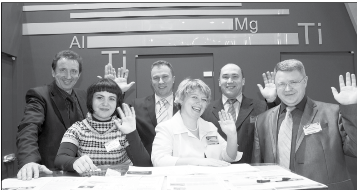
Команда ВСМПО на международной выставке

Но работа на стенде любой выставки – это лишь видимая часть айсберга. Только для того, чтобы согласовать время встреч и составы переговор-