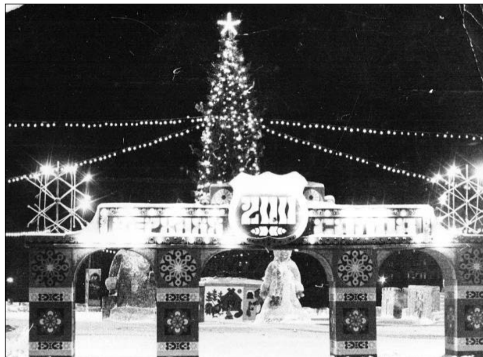
Зимний городок 1978 года