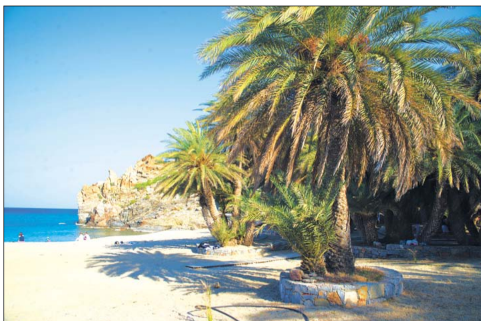
Пальмовый рай. Один из самых красивых пляжей Крита – пляж Вай, знаменит пальмовой рощей, где растёт около 5000 пальм