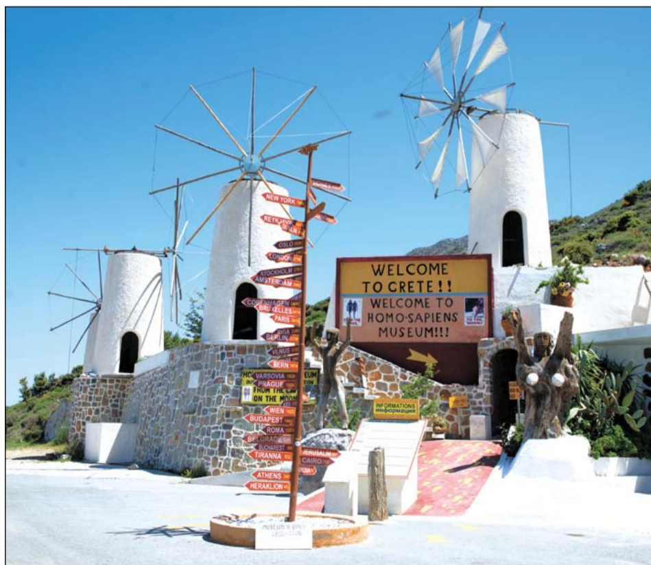
10-15 лет назад на острове Крит находились тысячи ветряных мельниц, которые доставляли воду для орошения земли. Сейчас воду качают электронасосы