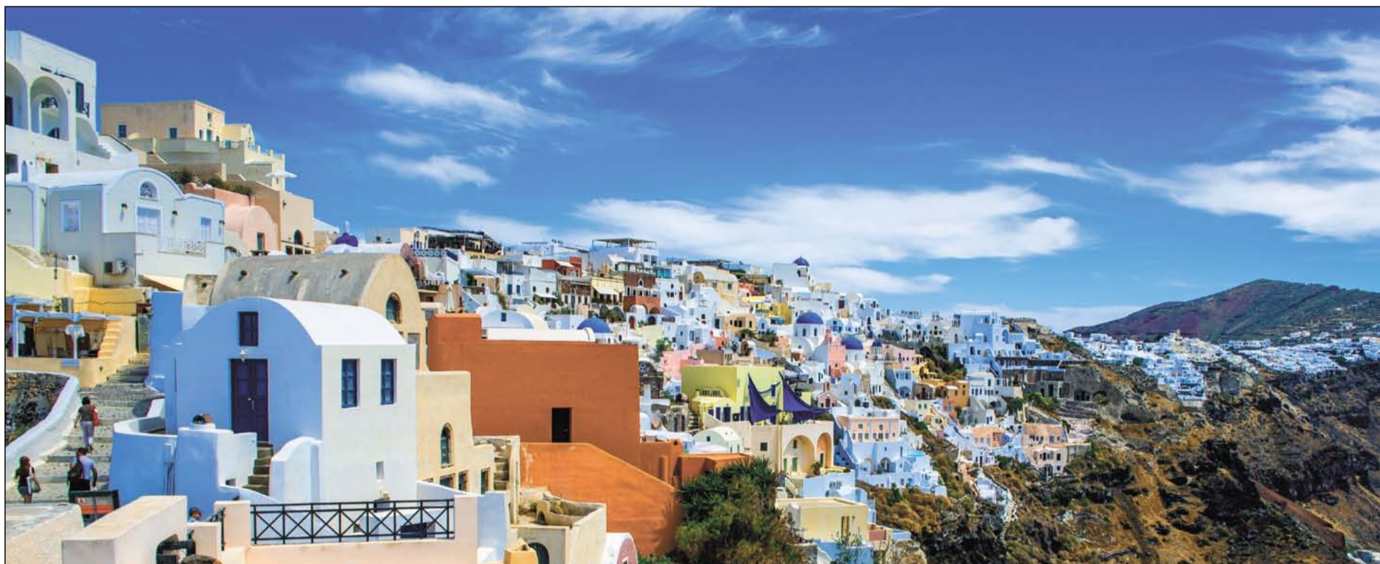
Ия – живописнейший городок острова Тира, входящего в архипелаг Санторини. По запутанным улочкам городка с множеством лесенок и бело-синих церквушек можно бродить бесконечно