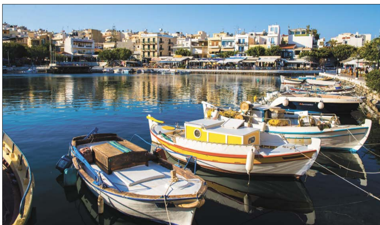
Озеро Вулизмени находится прямо в центре города Агиос Николаос. Оно соединяется каналом с морем, но при этом остаётся пресноводным