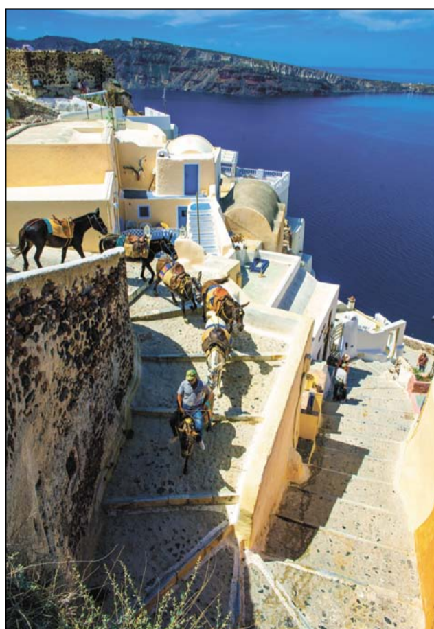
На улицах постоянно встречаются симпатичные ослики – один из символов Санторини