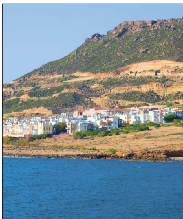
Город-призрак – бывший пятизвёздочный отель. Построен на скалистом пустынном берегу бухты