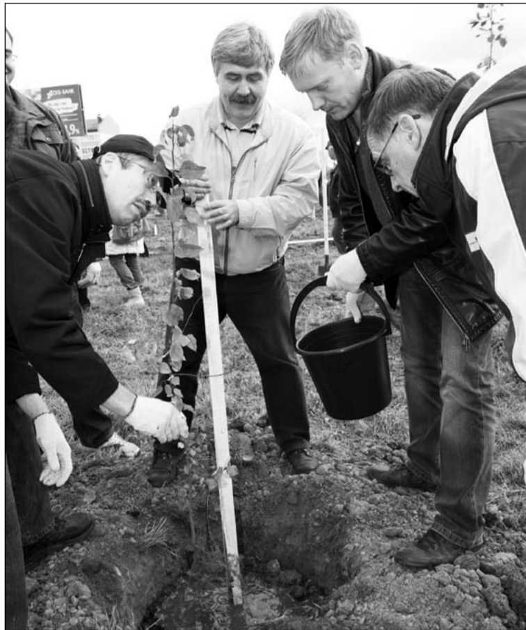
Сентябрь 2011 года