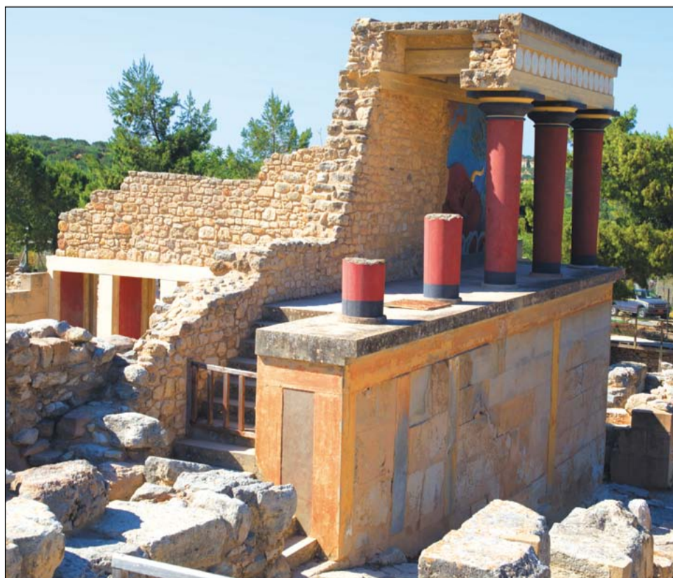
Кносский дворец – выдающийся памятник критской архитектуры – из-за размеров строения и его сложности ассоциируют с Лабиринтом, в котором обитал Минотавр