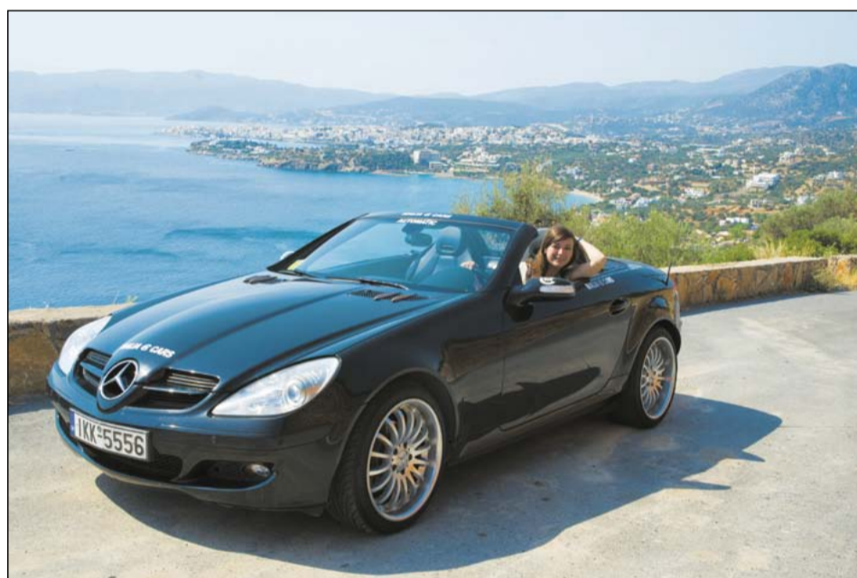
Путешествовать по острову Крит лучше всего на автомобиле. На заднем плане виден самый престижный курорт Крита – Элунда