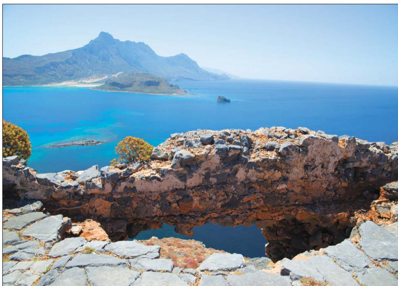
Из крепости на острове Грамвуса открывается потрясающий вид на слияние трёх морей – Эгейского, Ионического и Ливийского. Просто дух захватывает!