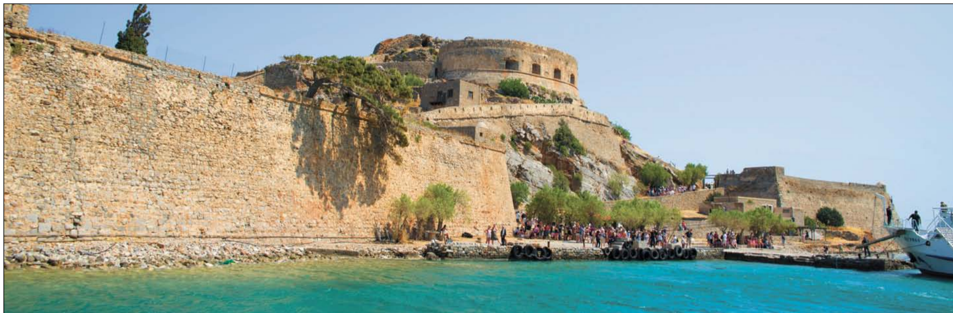
Остров Спиналонга долгое время находился под контролем турок. Чтобы прогнать турок, греки собрали прокажённых со всей Греции и отправили их на остров. Лепрозорий просуществовал здесь с 1903 по 1957 год

Чистейшее море, белые стены домов и голубые крыши – именно этот умиротворяющий вид чаще всего можно встретить на открытках с видами Греции. В нашем фотоотпуске запечатлены достопримечательности Эллады и в другом ракурсе.