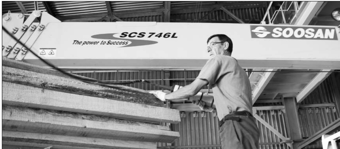
Строители принимают доски для опалубки

Ещё вчера поворот на новый участок цеха № 22, расположившийся на площадях «Алюминиевого профиля», выглядел как обычная грунтовая дорога. И оператор пресс-службы ВСМПО, дабы не стряхнуть видеокamerу, предупредительно взял её на руки. Каково же было наше удивление, когда под колёсами заводского автомобиля еле слышно зашуршал ровный асфальт.