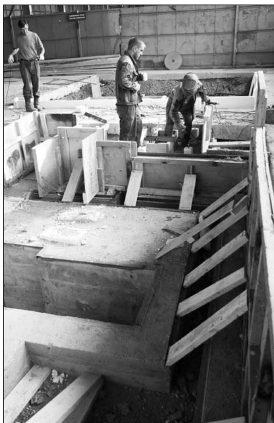
Фундамент строят – только щепки летят