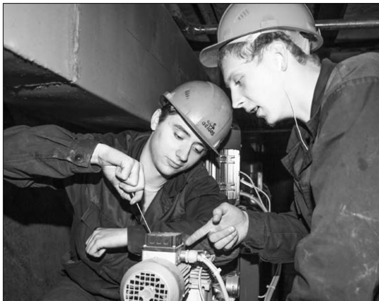
Очень важно правильно подсоединить оборудование новой системы