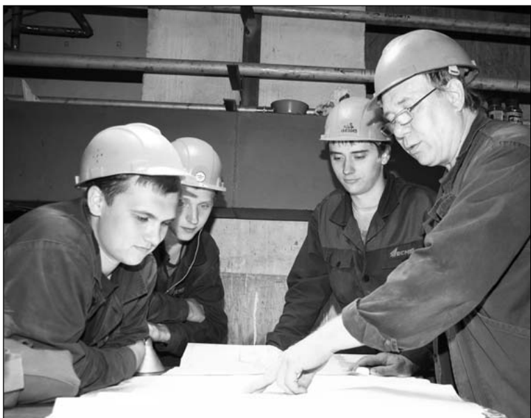
Каждая рабочая смена электромонтажников начинается с изучения чертежей